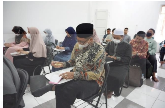
Gambar 5. Peserta Mengisi Angket