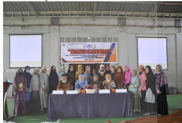
Gambar 1. Orientasi Awal Tempat Pelaksanaan PKM

Dalam kegiatan pembelajaran ada beberapa faktor yang berperan dalam pembelajaran yaitu faktor guru, siswa, buku ajar, dan evaluasi hasil belajar. Pertama faktor guru, kompetensi guru pada dasarnya sudah memadai tetapi dalam melaksanakan pembelajaran dan evaluasi untuk peningkatan prestasi belajar masih perlu ditingkatkan. Kedua faktor siswa, kemampuan dalam mengakses, memahami, dan menggunakan informasi secara cerdas berdampak negatif pada proses pembelajaran, antara lain siswa lebih cenderung menemukan informasi secara instan seperti melalui internet yang tidak selektif. Ketiga faktor fasilitas ruang baca dan buku bacaan, ketersediaan fasilitas dan buku bacaan tidak terpenuhi untuk kebutuhan belajar siswa mengakibatkan proses pembelajaran di kelas kurang kreatif dan siswa tidak memiliki peluang yang cukup untuk belajar mandiri. Keempat budaya membaca dan menulis peserta didik sangat rendah. Kelima faktor evaluasi hasil belajar, kecenderungan penilaian guru masih mengacu pada evaluasi belajar lewat tes.