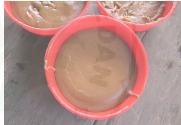
Gambar 6. Proses Pemasakan Gula Nipah