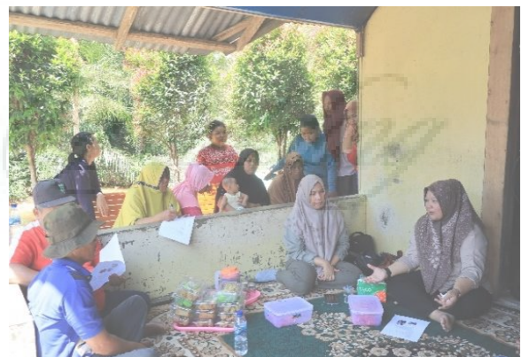
Gambar 2. Sosialisasi dan Presentasi Kegiatan PKM

Kegiatan awal yang dilaksanakan yaitu sosialisasi dan pemberian alat kepada kelompok Nipah di Desa Kwala Serapuh, Kecamatan Tanjung Pura, Kabupaten Langkat. Kegiatan ini dilaksanakan di salah satu rumah warga dan dihadiri oleh ± 20 orang yang terdiri oleh ketua serta anggota kelompok Nipah serta masyarakat desa. Dalam kegiatan yang dilakukan ini tim pengabdian melakukan sosialisasi mengenai potensi nipah dan pelestarian mangrove nipah yang tidak hanya memberi manfaat ekologi namun juga dapat memberikan manfaat ekonomis bagi masyarakat. Manfaat ekonomis dari Nipah ( Nypa fructucandi ) berupa nira dari tumbuhan ini yang dapat diolah untuk menjadi gula.