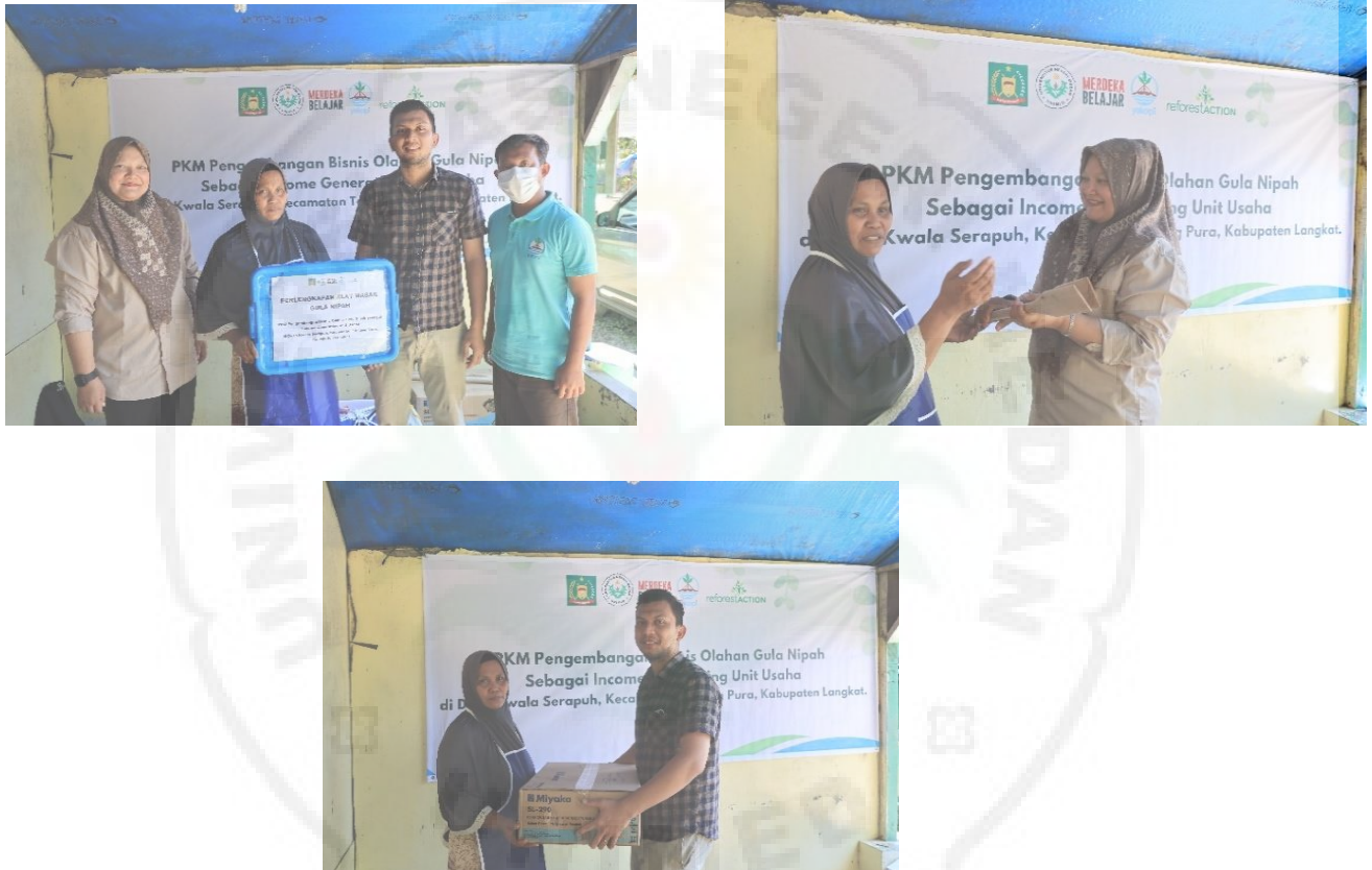
Gambar 3. Pemberian Bantuan Alat oleh Tim PKM

harapannya dapat menimbulkan semangat masyarakat Desa Kwala Serapuh yang dalam kegiatan ini diwakilkan oleh kelompok Nipah untuk memproduksi gula nipah sendiri. Dokumentasi kegiatan pemberian alat masak ini dapat dilihat pada Gambar 3 berikut