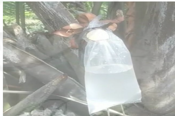
Gambar 5. Proses Pengambilan Nira Nipah

Pada kegiatan pendampingan selanjutnya telah dilakukan praktik langsung pembuatan gula nipah dari nira nipah yang telah dipanen sebelumnya. Nira nipah yang telah dipanen tersebut dimasukkan kedalam kuali. Nira nipah disaring terlebih dahulu sebelum dimasukkan ke dalam kuali. Lalu masak nira nipah menggunakan kompor dengan api sedang.