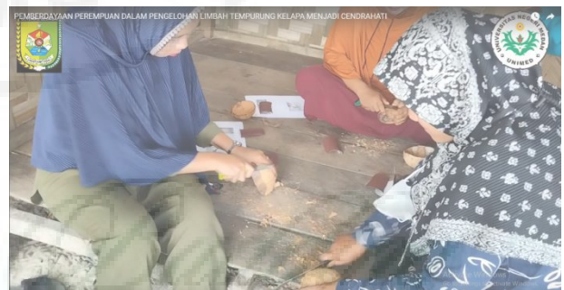
Gambar 3. Membersihkan sisa kelapa