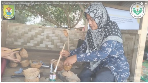
Gambar 4. Mempernis tempurung kelapa