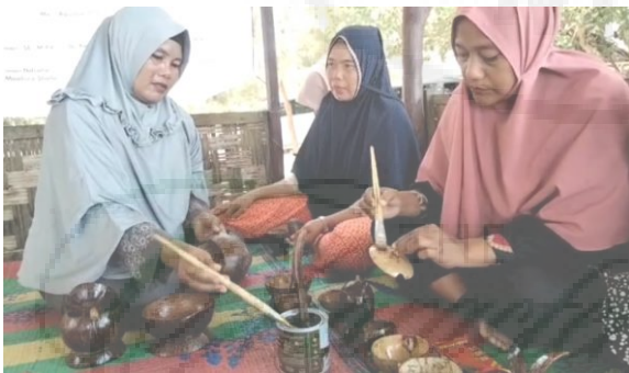
Gambar 2. Proses pembuatan kerajinan

Pelaksanaan pemberdayaan perempuan yang dilakukan oleh tim yang bekerjasama dengan kepala lingkungan di desa Sentang Kabupaten Serdang Bedagai Provinsi Sumatera Utara tersebut telah dilaksanakan dalam total waktu itu 1 (satu) bulan dengan mengadakan pertemuan sebanyak 3 (tiga) kali dengan beberapa tahapan dan juga proses yang dilalui oleh warga desa yang ada di lingkungan tersebut. Adapun beberapa tahapan dan proses yang dilalui oleh warga desa atau rumah khususnya bagi ibu-ibu dan perempuan dalam berpartisipasi melalui pelatihan pengelolaan limbah tempurung kelapa menjadi cenderahati yaitu :