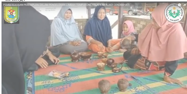
Gambar 5. Hasil karya cenderahati dari tempurung kelapa yang telah dibuat oleh ibu-ibu desa sentang

Berdasarkan sebuah analisis dari program kegiatan yang terlaksana dengan berdasarkan tahapan mekanisme diatas dapat dijelaskan bahwa ketercapaian indikator keberhasilan program yang telah dilaksanakan bersama kelompok pengabdian (tim) dan mitra. Pelaksanaan proses pendampingan yang telah dilakukan kepada ibu rumah tangga dalam pengolahan tempurung kelapa menjadi cenderahati memiliki dampak yang positif khususnya dalam mengembangkan kompetensi ibu rumah tangga dalam mengolah tempurung kelapa dan menghinovasikanya menjadi produk UMKM, khas daerah. Bahkan ibu rumah tangga telah memiliki ide dan kreatifitas baru dalam mengolah tempurung kelapa dalam berbagai variasi yang dimana selama ini tempurung kelapa hanya di jual begitu saja dan hanya di olah menjadi arang.