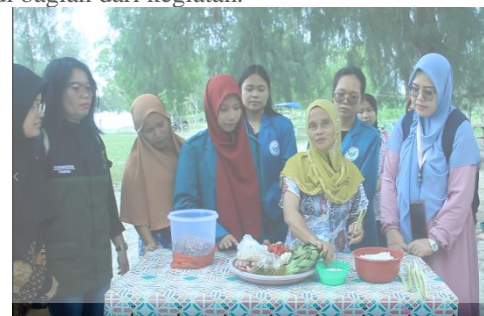
Gambar 6. Pembuatan Abon Kerang

Kegiatan ini dilaksanakan pada tanggal 23 Juni 2022. Sebelum kegiatan pendampingan dilakukan, semua ibu rumah tangga yang telah dibentuk sebagai kelompok diberikan soal pre test untuk mengukur kemampuan pengetahuan Ibu rumah tangga sebelum diberikan pelatihan yang kemudian dievaluasi menurut skor yang diperoleh setiap peserta. Selanjutnya tim memberikan penjelasan runtut seputar materi pembuatan abon kerang, sebagai penguatan awal. Setelah kegiatan pre test maka kegiatan selanjutnya, yakni memberikan pendampingan seputar pengolahan kerang menjadi abon. Tim bersama mahasiswa melakukan kegiatan ini dengan memperkenalkan bahan alat dan bumbu dasar yang digunakan, selain itu, pendampingan dalam pembuatan label brand hingga proses pengemasan dan pemasaran, juga menjadi bagian dari kegiatan.