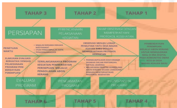
Gambar 4. Alur Tahapan Pelaksanaan Program Pemberdayaan Perempuan

Program pembuatan abon kerang yang bertujuan menjadi salah satu jawaban dari permasalahan kemiskinan yang ada di desa Bagan Asahan Baru dengan memanfaatkan kerang yang didapat oleh nelayan tradisional setempat dan diharapkan mampu menjadi salah satu program yang dapat menciptakan camilan iconic khas desa Sentang maupun Sumatera Utara dengan kemasan yang menarik. Adapun pada akhir kegiatan ini, tim pelaksana akan melakukan evaluasi yang berkaitan dengan pelaksanaan pemberdayaan perempuan dan mengevaluasi pemahaman ibu rumah tangga dalam pengolahan kerang menjadi abon, dengan melihat perubahan yang telah dihasilkan, sbelum adanya penerapan kegiatan dan setelah kegiatan di laksanakan dengan merujuk kepada keadaan real di lapangan. Pada tahap penerapan kegiatan, agenda yang dilakukan dalam berupa pelatihan dalam pengolahan kerang menjadi abon yang merujuk pada diagram Fishbond dibawah ini :