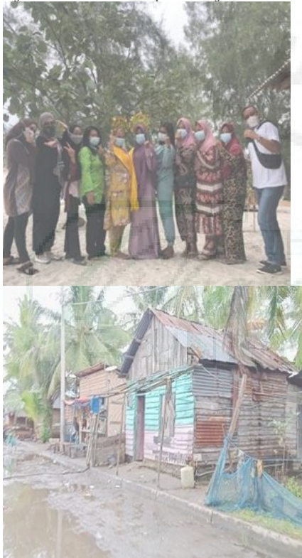
Gambar 1. Ibu rumah tangga dan tempat tinggal di Desa Sentang

Berdasarkan rumah tempat tinggal sebagian bangunan rumah penduduk masih berupa bangunan non permanen, sedangkan lainnya merupakan bangunan permanen dan rumah yang tidak layak huni yang masih berada di Desa Sentang akibat kurang memadainya pekerjaan mereka sehingga pendapatan yang diperoleh tidak cukup menghidupi keluarga dan untuk merenovasi bangunan rumah. Keadaan ini menunjukkan kesejahteraan ekonomi penduduk desa yang belum merata di Desa Sentang. Sehingga masyarakat desa membutuhkan keahlian dan pembangunan kapasitas khususnya perempuan (Rosramadhana et al., 2022) yang ditinggal merantau oleh suaminya untuk meningkatkan taraf hidup dan ekonomi keluarga, dimana berdasarkan survey yang dilakukan, perempuan sebagai ibu rumah tangga dapat diberdayakan untuk meningkatkan pendapatan rumahtangga (Saleh et al., 2022). Adapun menurut Indrajit dan Soimin (2014) menyatakan bahwasanya kemandirian dan demokrasi desa merupakan alat dan peta jalan untuk mencapai kesejahteraan rakyat desa.