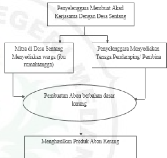
Gambar. 3 Prosedur Kerja Pendampingan

Susunan alur penerapan kegiatan pemberdayaan masyarakat dalam pembuatan abon kerang yang terbagi kedalam empat bentuk tahapan utama yakni perencanaan, pengorganisasian, aktualisasi, serta monitoring evaluasi :