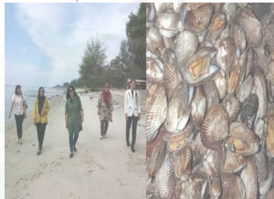
Gambar 2. Pesisir dan potensi pantai Desa Sentang

Bedagai khususnya, tingkat pendidikan dan ekonomi yang masih rendah. Keberadaan perempuan sebagai ibu rumah tangga yang tidak bekerja, dengan kondisi sosio kultural etnis Melayu yang bertahan menunggu suami pulang bekerja sehingga tidak produktif, kurangnya kemampuan mitra dalam mengembangkan potensi perempuan dan ibu rumah tangga, pendidikan dari keluarga yang kurang mengedukasi tentang pemanfaatan sumberdaya menjadi inovasi tepat guna karena minimnya pendidikan dan keterampilan keluarga dan masyarakat di desa Sentang, serta kurangnya kreatifitas perempuan dan ibu rumah tangga, disebabkan minimnya mitra yang memberikan pendampingan untuk upaya meningkatkan potensi daerah tersebut.\