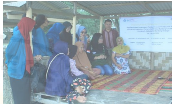
Gambar 5. Sosialisasi Pembuatan Abon Kerang

Teluk Mengkudu Kabupaten Serdang Bedagai 18 Juni 2022.