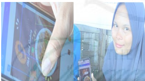
Gambar 7. Proses pembuatan Stiker untuk Packaging Abon kerang

Dilakukan pada tanggal 29 Juni 2022 dengan memberikan pelatihan pembuatan desain stiker untuk pacjkaging. Kegiatan ini dilakukan dengan memanfaatkan smartphone dan aplikasi canva, pada kegiatan ini perempuan dan ibu rumahtangga di perkenalkan aplikasi canva beserta fitur yang ada didalamnya, peserta diajarkan dalam hal pemilihan warna jenis huruf ukuran huruf, pemilihan gambar, pemotongan dan penentuan template stiker yang akan digunakan agar lebih menarik. selanjutnya peserta kegiatan diarahkan membuat desain stuiker untuk dijadikan stiker kemasan abon kerang dengan berbekal tutorial yang telah di demo dan tetap didampingi oleh tim untuk pengarahan.