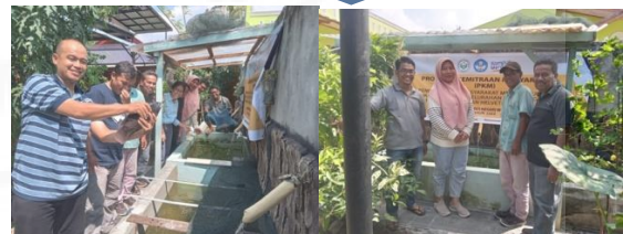
Gambar 3. Proses Kegiatan PKM di Kelurahan Tanjung Gusta