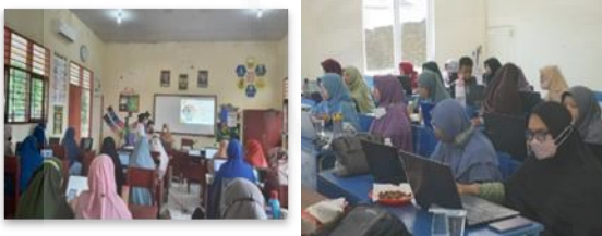
Gambar 3. Proses Pelaksanaan Pelatihan Secara Luring.

Pelaksanaan pelatihan berlangsung dengan lancar dan para guru mengikuti dengan antusias. Sejalan dengan hal itu, terdapat peningkatan kemampuan guru dalam mengembangkan LKPD digital interaktif.