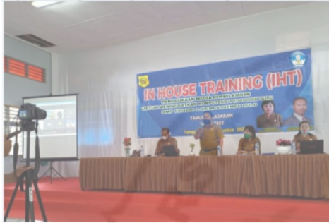
Gambar 1 : Kegiatan Pembukaan In House Training (IHT) dan Penyajian Materi

Point. Melalui kegiatan pelatihan ini diperoleh 68% peserta paham menggunakan media pembelajaran. Kegiatan ini mendukung temuan Wafrotur Rahmah (2016) yang mengemukakan kompetensi pedagogis dapat meningkatkan profesionalitas guru.