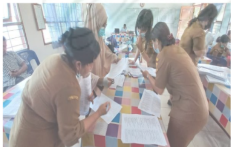
Gambar 3 : Kegiatan Pelatihan dalam bentuk Workshop / In House Training (IHT) secara blended (luring dan daring)