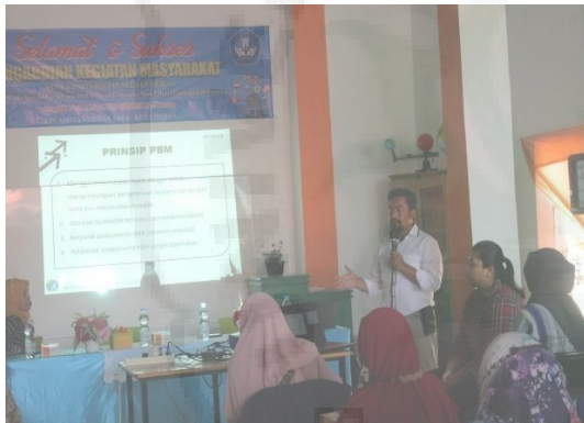
Gambar 2. Proses Pelaksanaan Pengabdian Kegiatan ini di awali dengan tes awal,

pendalaman materi, perancangan pembelajaran, simulasi, tes akhir, refleksi. Tes awal dilakukan dengan tujuan untuk memperoleh informasi awal grade pemahaman guru-guru terhadap berbagai model-model pembelajaran berbasis student centered, tes dilakukan sebelum pendalaman materi. Setelah pendalaman materi dan simulasi kemudian dilanjutkan tes akhir untuk mengetahui sejauh mana keberhasilan peserta dalam mengikuti program yang telah dilakukan. Deskripsi tingkat keberhasilan kegiatan dapat dilihat pada grafik berikut ini.