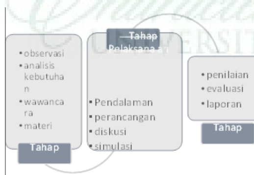
Gambar 1. Alur Kegiatan PKM ((Suciati, 2018)

Kegiatan pengabdian ini dilakukan dalam bentuk pelatihan dan pendampingan, diharapkan setelah selesai kegiatan ini para guru-guru PKBM Al Ikhran di Kecamatan Medan Area mengetahui, memahami, dan mampu menerapkan secara baik model-model pembelajaran abad 21 ke dalam konteks pelaksanaan pembelajaran. Pelaksanaan kegiatan ini dilakukan secara luring dan daring dengan tetap memenuhi protokol kesehatan (memakai masker, sudah vaksin ke-2, dan setiap acara kegiatan dilakukan pengukuran suhu tubuh) (Wijaya et al., 2020). Berikut gambaran kegiatan yang dilalui dalam 3 (tiga) tahap, yaitu :