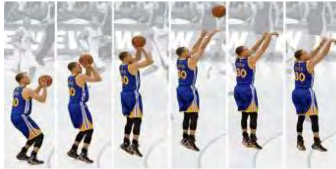
Shooting Basketball