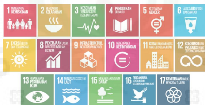
Gambar 1. 17 Tujuan Pembangunan Berkelanjutan [2]

Pembangunan berkelanjutan adalah pembangunan untuk memenuhi kebutuhan saat ini dengan tidak mengurangi kemampuan generasi mendatang dalam memenuhi kebutuhan mereka sendiri. Untuk mencapai tujuan tersebut dibutuhkan tindakan dari semua bidang atau stakeholders , yaitu pemerintah, kalangan bisnis dan masyarakat [1]. Pembangunan berkelanjutan bertujuan, seperti yang disepakati oleh para pemimpin dunia yang tergabung dalam Persatuan bangsa-bangsa (PBB) termasuk Indonesia, melakukan aksi global untuk mengakhiri kemiskinan, mengurangi kesenjangan dan melindungi lingkungan. Tujuan Pembangunan Berkelanjutan atau Sustainable Development Goals (SDGs) berisi 17 Tujuan dan 169 Target yang diharapkan dapat dicapai pada tahun 2030 [2].