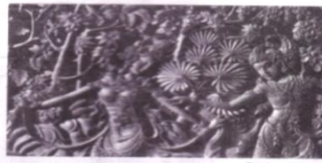
Relief pada candi

Sejak zaman dahulu, bangunan bersejarah telah menarik perhatian dan tidak sedikit orang mempelajarinya. Mereka ingin mengetahui dengan jelas kisah bangunan itu. Karena itulah, bangunan bersejarah menjadi objek wisata dan penelitian.