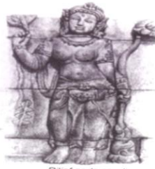
Relief pada candi

Di Indonesia banyak dijumpai bangunan yang bernilai sejarah. Ada bangunan yang kecil dan sederhana, ada pula bangunan yang besar serta megah. Ada yang dibuat dari batu, ada juga yang dibuat dari kayu. Bangunan tersebut dibangun sesuai dengan kebutuhannya.