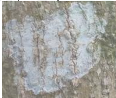
Gambar.3. Lepraria sp (Tipe Crustose)

Lepraria sp termasuk kedalam famili leprariaceae. Talusnya bertipe crustose. Warna dari talusnya abu-abu dengan bentuk talus membulat. Garis tepi pada talus tampak jelas dan berwarna putih. Pada bagian talusnya terdapat soredia atau butiran-butiran halus yang dapat dirasakan pada permukaanya.