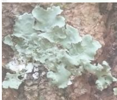
Gambar. 9. Rimelia reticulata ( Tipe Foliose)

Rimelia reticulata termasuk kedalam famili . tipe talusnya foliose. Warna talusnya kehijauan bagian pingirnya tidak beraturan dan tidak membulat sehingga dapat kita lihat dan kita amati. Tumbuh menempel pada pohon yang masih hidup sehingga lichenes ini tumbuh subur pada tempatnya.