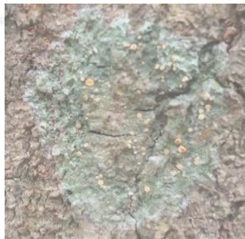
Gambar 11. Baeomyces rufus (Tipe Foliose)

Baeomyces rufus termasuk kedalam famili Baeomycetaceae dengan tipe talus Foliose. Warna talus hijau gelap dengan bintik-bintik kuning dibagian tengahnya. Bentuk talusnya bulat dan menempel pada pohon yang tumbuh subur. Lichenes jenis ini tumbuh pada pohon yang memiliki tekstur keras dan tidak muda retak.