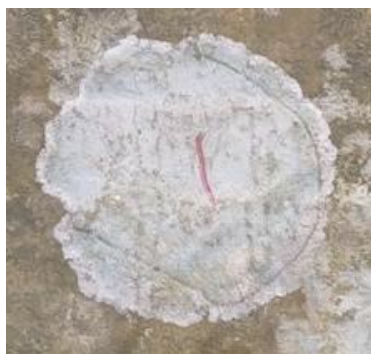
Gambar. 8. Graphis scripta (Tipe Crustose)

Graphis scripta termasuk kedalam famili graphidaceae. Tipe talus yaitu Crustose. Warna talusnya keputihan dan menempel pada substratnya. Dijumpai pada pohon yang masi hidup.