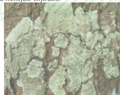
Gambar 7. Lecanora thysanophara (Tipe Crustose)

Lecanora thysanophara termasuk kedalam famili lecanoraceae. Tipe talusnya Crostose. Warna talusnya kehijau-hijauan