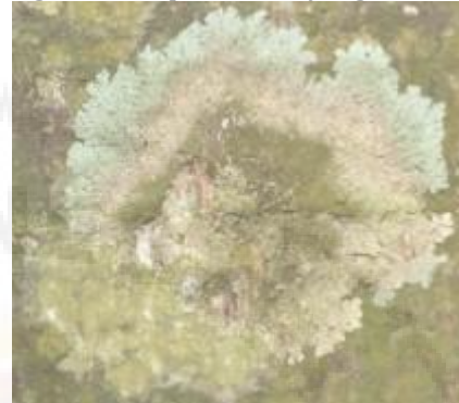
Gambar 5. Parmelia caperata (Tipe Foliose)

Parmelia caperata termasuk kedalam famili Parmeliaceae. Tipe talusnya foliose. Talusnya membulat bergerigi dengan warna talus keabu-abuan. Lichenes ini tumbuh subur pada tegakan pohon yang masih hidup.