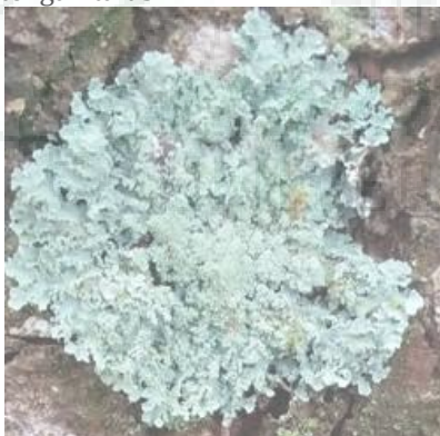
Gambar 4. Parmelia plumbea (Tipe Foliose)

Parmelia plumbea termasuk kedalam family Parmeliaceae. Tipe talusnya termasuk foliose dengan warna hijau keabuan. Bentuk talus membulat dan tepian talusnya berwarna putih. Terdapat bulatan kecil berwarna putih pada bageian tengah talus.