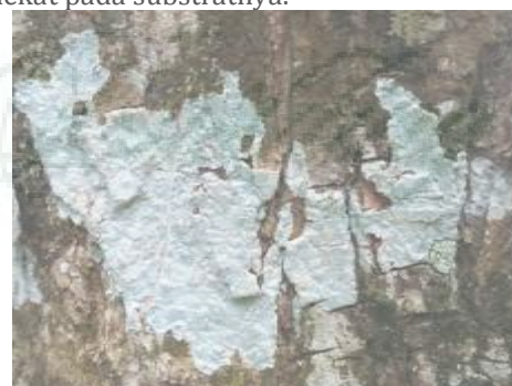
Gambar 1. Ochrolechia tartarea ( Tipe Foliose)

Lichenes Ochrolechia tartarea termasuk kedalam famili Lecanorineae. Ochrolechia tartarea memiliki tipe talus yang berwarna keabu-abuan dan melekat pada substratnya.