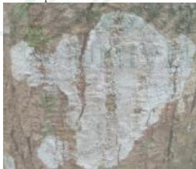
Gambar.10. Pyrrhospora querneae (Tipe Crustose)

Pyrrhospora querneae termasuk kedalam famili Lecanoraceae. Dan memiliki tipe talus Crustose, lichenes ini menempel pada pohon. Mimiliki warna putih.