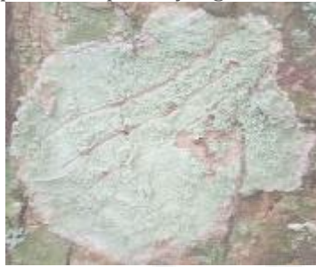
Gambar 2. Lepraria incana (Tipe Crustose)

yang dapat dirasakan saat diraba. Warna dari Lepraria incana hijau keabuan dan dapat dijumpain pada kulit pohon yang masih hidup.