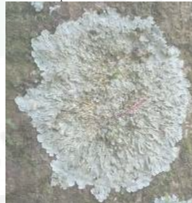
Gambar .6. Parmelia saxatilis (Tipe Foliose)

Parmelia saxatilis termasuk kedalam famili Parmeliaceae. Tipe talusnya foliose. Warna talusnya keabuan. Berbentuk agak bulat dan melekat pada substrat pohon.