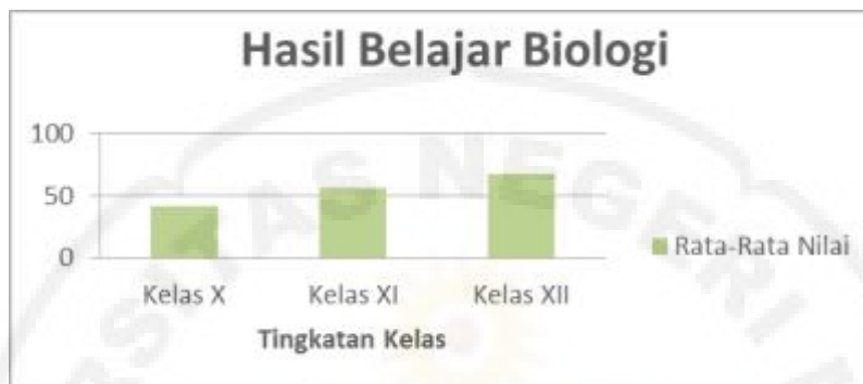
Gambar 3. Data Hasil Belajar Biologi Siswa

Leidong berbeda-beda pada setiap tingkatan kelas. Untuk lebih jelasnya dapat dilihat pada diagram batang berikut.