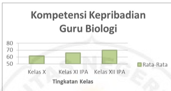
Gambar 1. Kompetensi kepribadian Guru Biologi

beda. Untuk lebih jelasnya dapat dilihat pada diagram batang berikut.