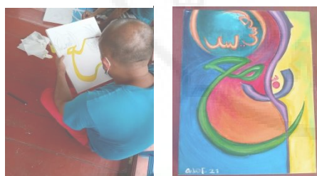
Gambar 2.3. Hasil Lukisan dari Monitoring Kegiatan

Kegiatan dimonitoring setelah serangkaian kegiatan dilaksanakan. Monitoring dilakukan untuk mengetahui sejauh mana mitra mampu dalam pembuatan lukisan kaligrafi kontemporer (Gambar 2.3).