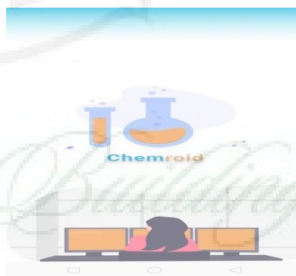
Gambar 1. Splash Screen

Pada splash screen ini, muncul selama 3 detik yang akan memunculkan logo aplikasi Chemroid .