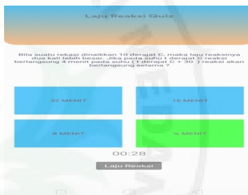
Gambar 4. Quiz

Pada halaman Quiz ini sama halnya seperti halaman utama yang menampilkan materi yang tersedia pada aplikasi tersebut serta menampilkan beginner quiz dan jika memilih salah satu quiz maka akan menampilkan soal pilihan berganda. Jika benar memilih jawaban maka opsi jawaban akan berwarna hijau sedangkan jika salah maka akan berwarna merah, setelah selesai menjawab semua quiz maka akan menampilkan halaman skor.