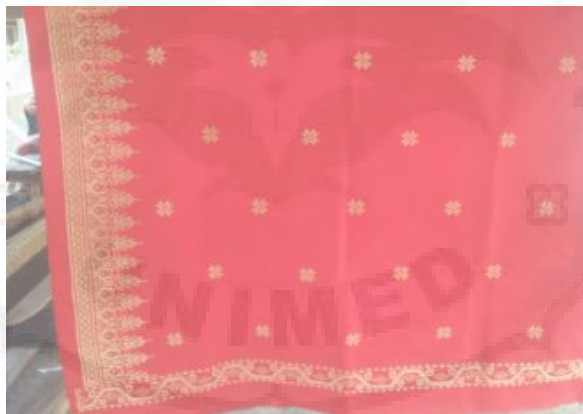
Kain Songket II