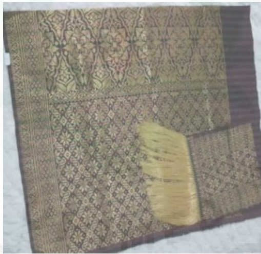
Kain Songket V