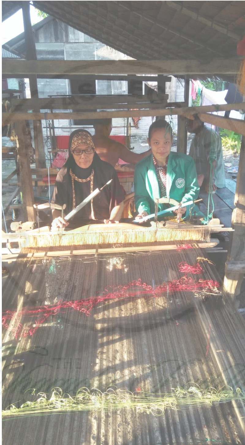
Gambar Peneliti Bersama Dengan Pengrajin