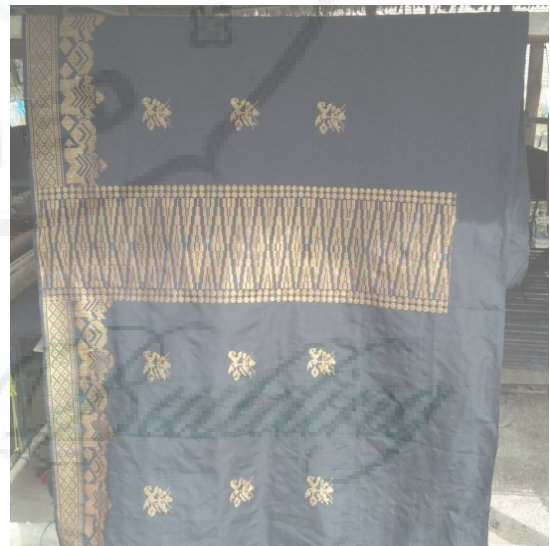
Kain Songket X