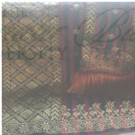
Kain Songket VI