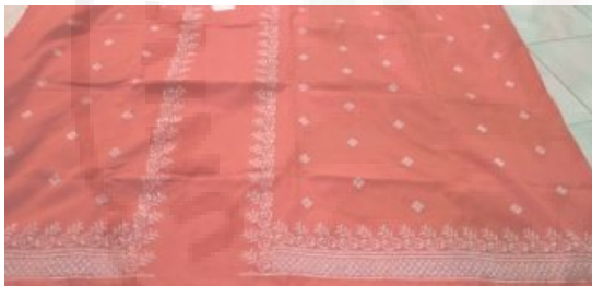
Kain Songket VIII