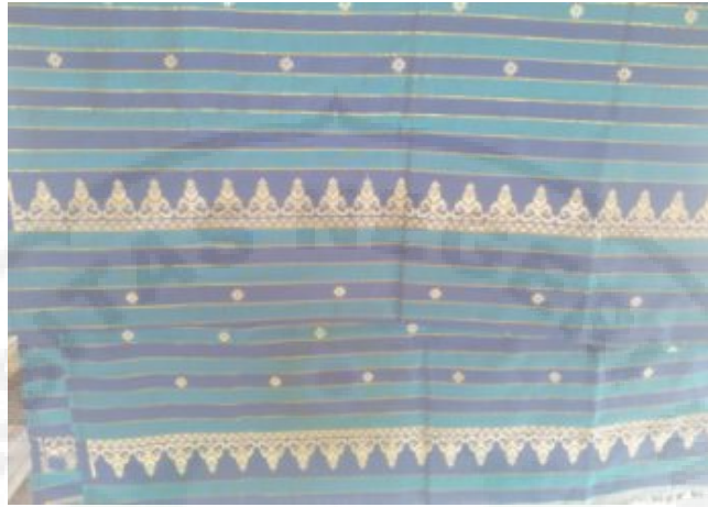
Kain Songket I