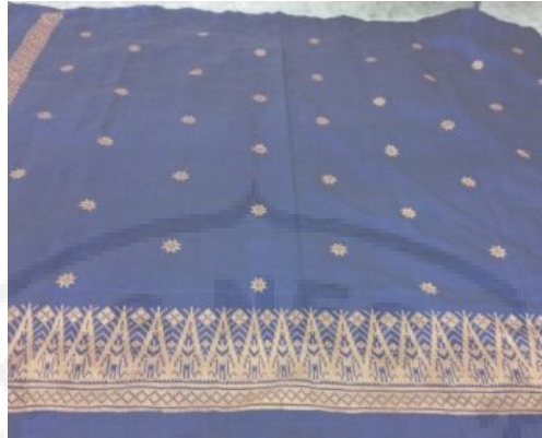
Kain Songket IV