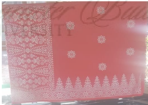
Kain Songket III