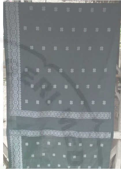
Kain Songket IX