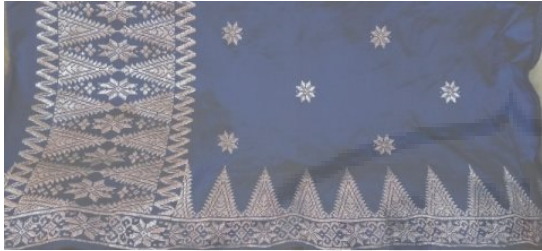
Kain Songket VII