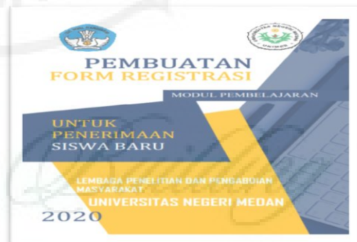
Gambar 2. Modul pelatihan yang