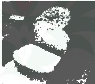
Gambar 1.1. Soal Penelitian Pendahuluan

Sebagai contoh, Ibu ingin membagi roti menjadi 6 potong sama besar. Roti tersebut diletakkan dalam piring. Adik mengambil 2 potong roti. Berapa bagian sisa roti pada piring? Pecahkan masalah ini kemudian bandingkan bagian roti yang diambil adik dengan yang ada dipiring menggunakan pecahan dan tanda matematika.