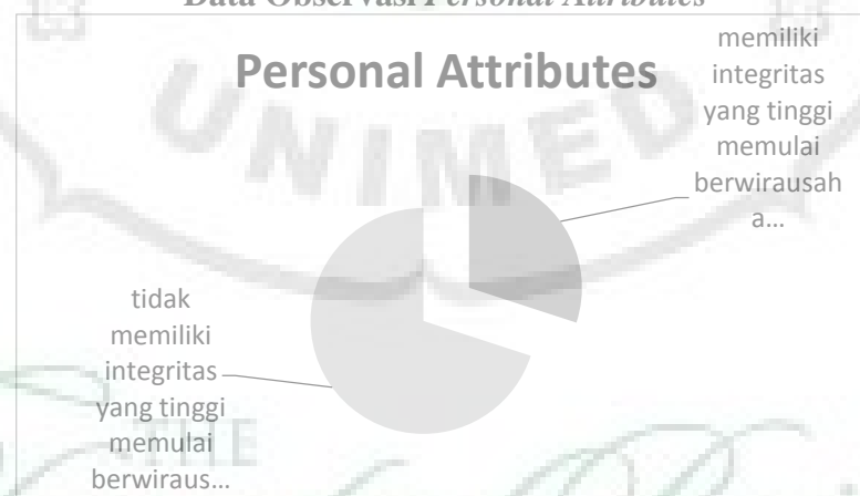
Gambar 1.3 Data Observasi Personal Attributes