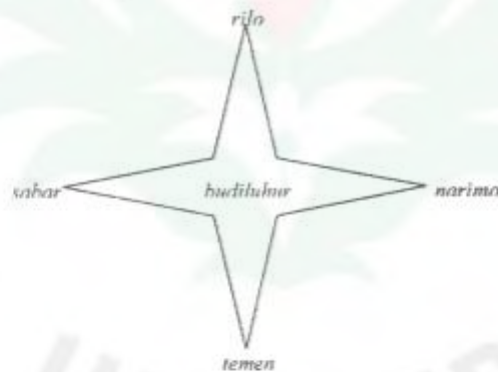
Gb. 3. Panca Sila dengan bentuk dasar garis vertikal dan horisontal. (Bahari, 2002)

Bentuk visual lainnya dari Panca Sila tersebut biasanya juga digambarkan seperti simbol arah mata angin dengan bentuk dasar garis vertikal dan horisontal yang dibuat menumpuk. Budiluhur terletak di tengahnya sebagai titik pusat yang merupakan titik pertemuan garis vertikal dan horisontal tersebut.