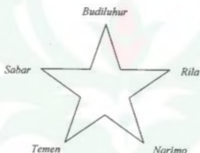
Gb. 2 Panca Sila dengan bentuk dasar bintang. (Bahari, 2002)

Bentuk visual dari Panca Sila yang merupakan pedoman hidup bagi masyarakat Jawa digambarkan dengan berbagai bentuk, seperti berwujud bintang, persegi lima, garis vertikal dan horisontal yang menumpuk, sebuah lingkaran yang dibagi menjadi empat bidang oleh garis vertikal dan horisontal di titik pusatnya dan gunung wayang. (Penggambaran ini berdasarkan hasil interpretasi penulis dan hasil wawancara mendalam dengan beberapa tokoh kebatinan di Bantul, Yogyakarta dan Jakarta antara lain Ki Sukisman, Sumardiyono, dan Kelik Prayoga). Wujud visualnya dapat digambarkan sebagai berikut: