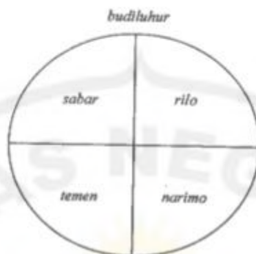
Gb. 4. Panca Sila dengan bentuk dasar garis vertikal dan horisontal dalam lingkaran (Bahari, 2002)

Lima dasar tersebut merupakan sikap hidup yang harus dipegang oleh murid dan para guru Pangestu. Kenyataannya banyak masyarakat Jawa yang telah melaksanakan sikap hidup Pangestu, meskipun mereka bukan murid atau anggota Pangestu. Mereka yang tidak masuk ke dalam aliran kebatinan tertentu, tetapi secara alami masih memegang teguh kebiasaan dan ajaran-ajaran dari orang tua, maka pandangan hidup serta pedoman hidupnya tidak akan jauh berbeda dengan ajaran Pangestu. Sikap hidup yang telah menjadi pedoman umum, merupakan etika masyarakat dan menjadi ukuran moral bagi masyarakat Jawa.