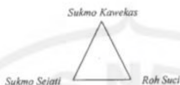
Gb. 1. Skema bentuk Tri Purusa (Bahari, 2002)

Purusa . Wujud visual dari Tri Purusa tersebut dapat digambarkan seperti di bawah ini :