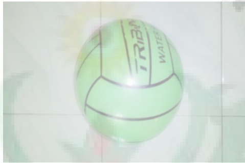
Gambar Modifikasi Bola Voli

( http://googlesearch/bolakaret/images )