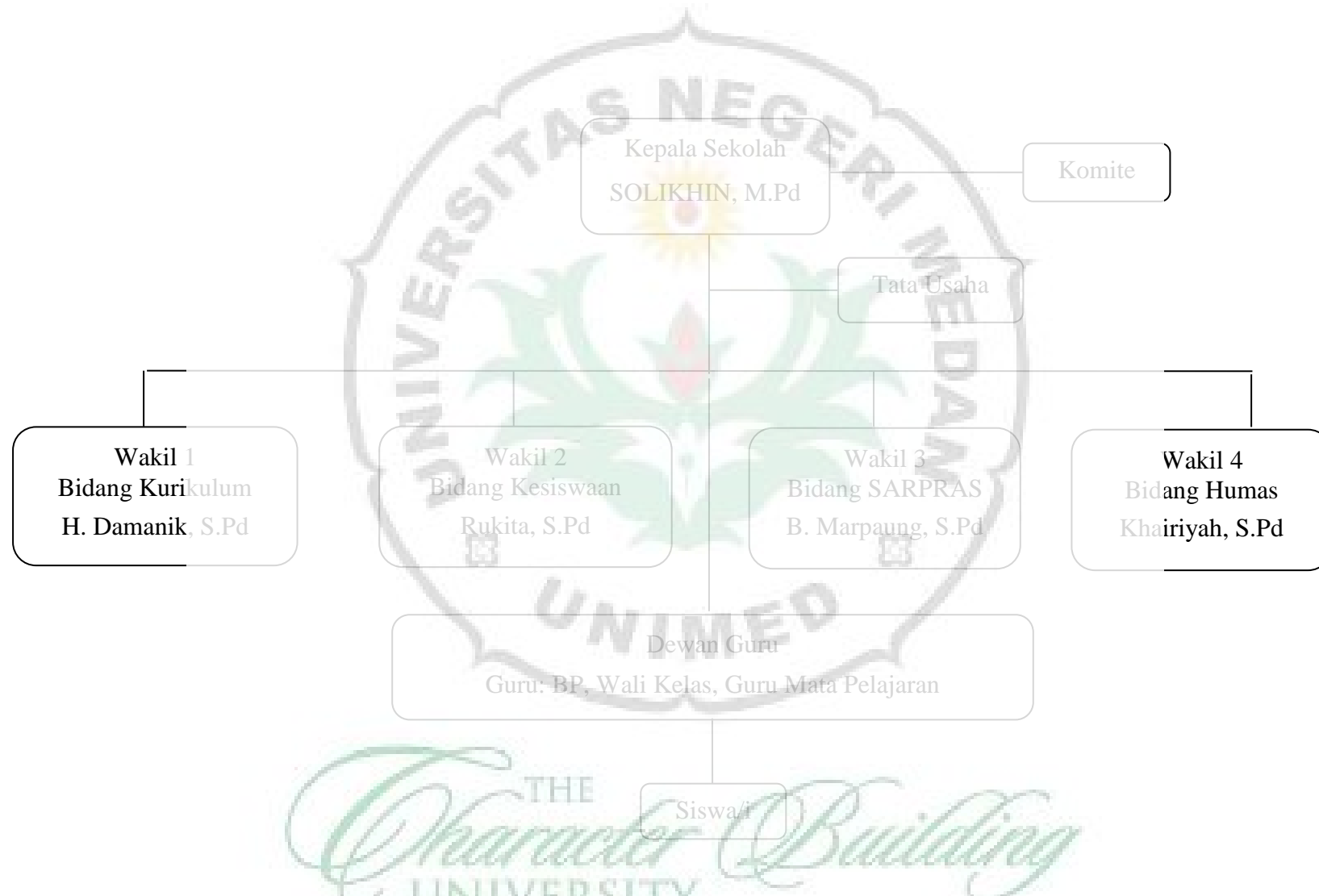
Gambar 2. Struktur Organisasi SMA Negeri 1 Kotapinang Tahun Ajaran 2017/2018