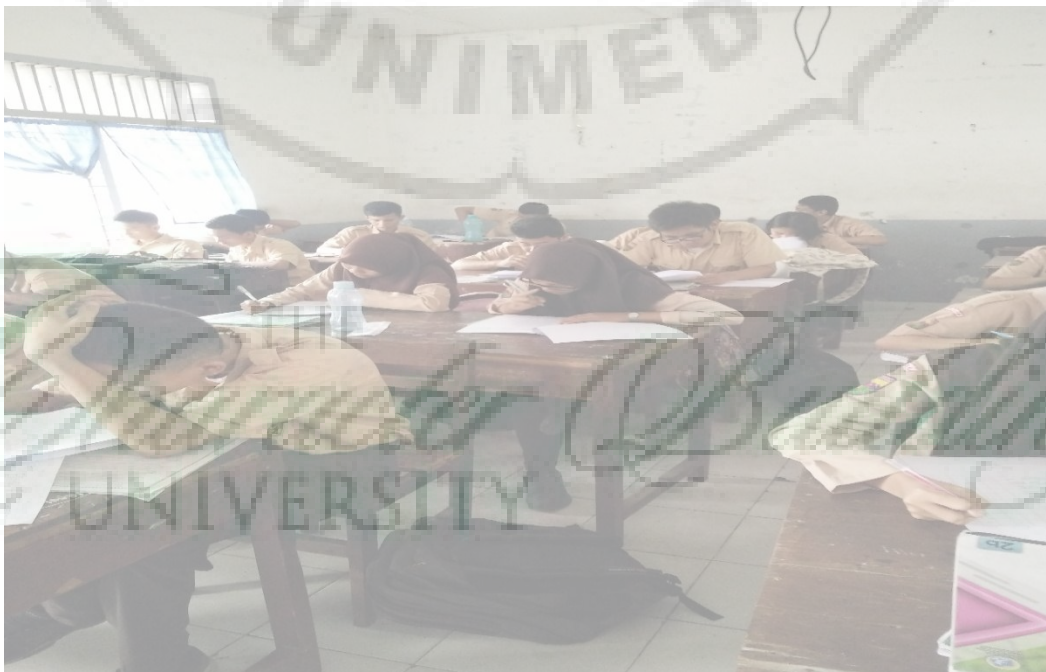
Gambar 2. Siswa saat mengisi angket