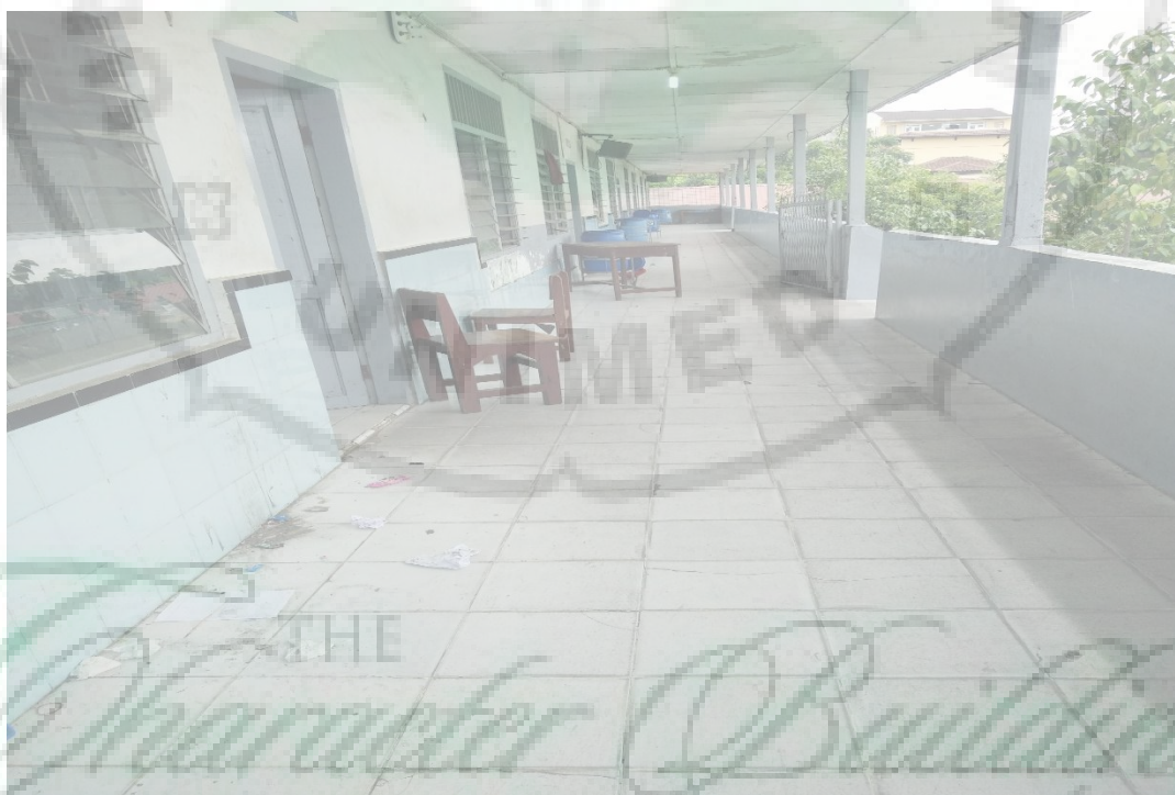
Gambar 3. Lorong kelas