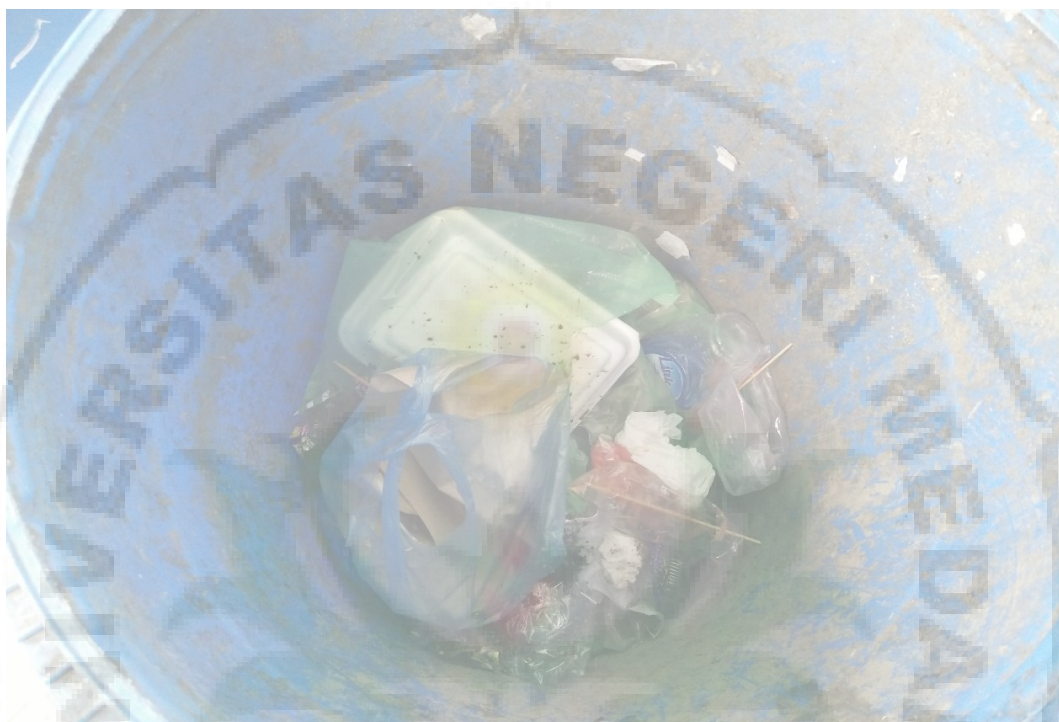
Gambar 8. Keadaan tong sampah yang masih bercampur sampah anorganik dan organik