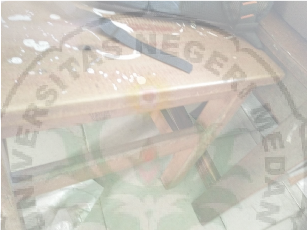
Gambar 6. Sampah kertas di bawah kursi siswa