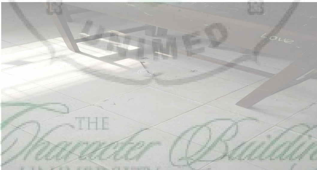
Gambar 5. Ruang kelas yang masih terlihat ada sampah