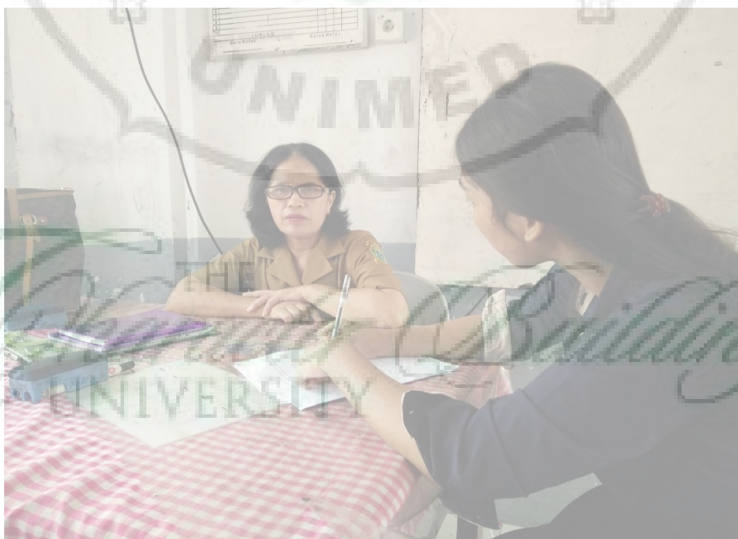
Gambar 9. Mewawancarai guru Biologi