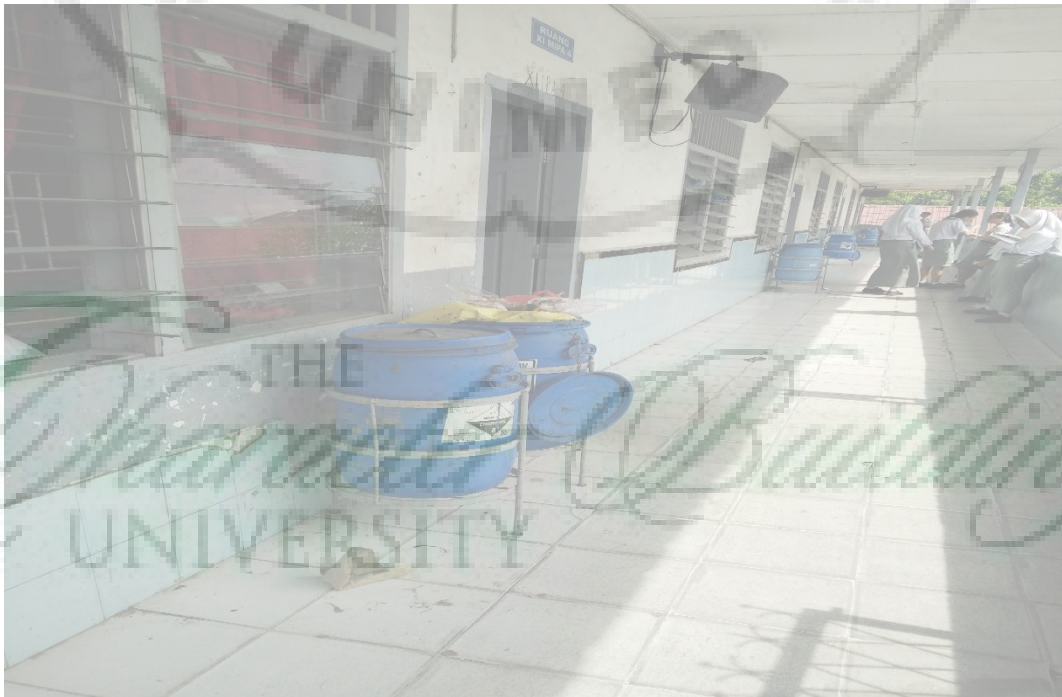
Gambar 7. Keadaan tong sampah