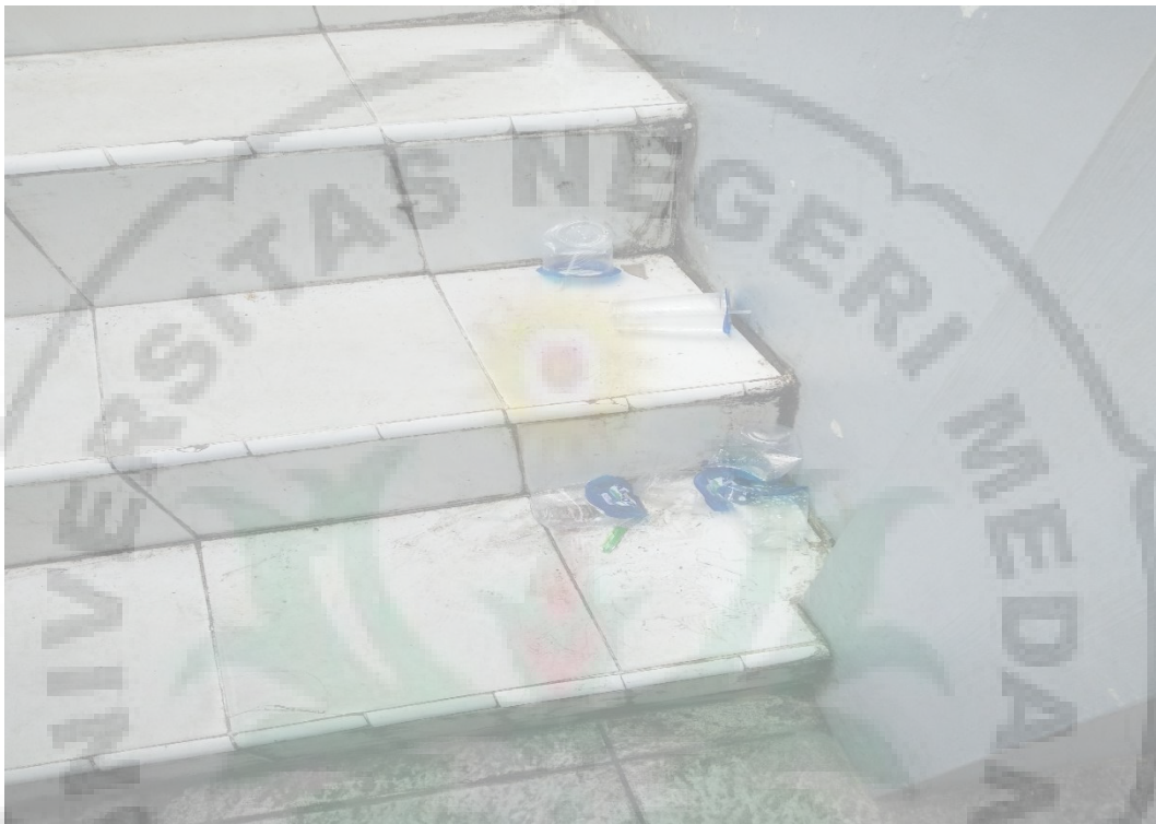
Gambar 4. Tangga kelas