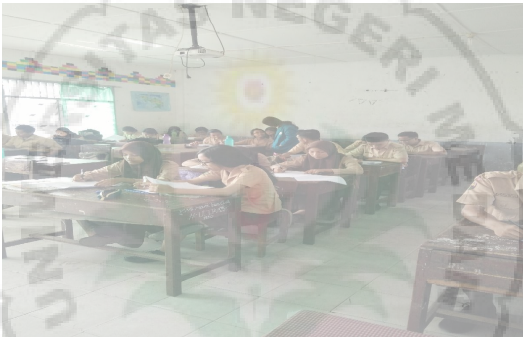
Gambar 1. Peneliti membimbing siswa mengisi angket