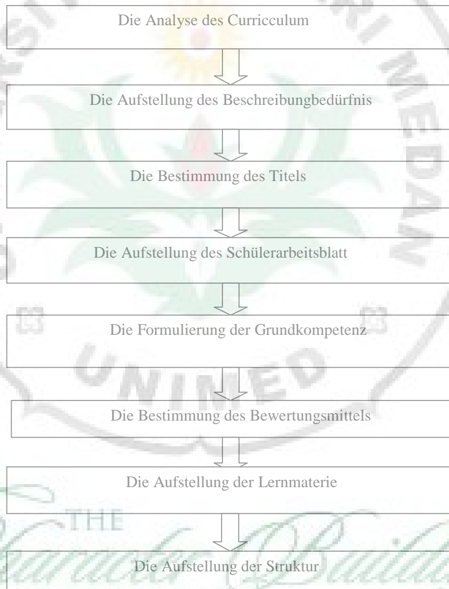
Schema 1: die Entwicklungsschritte der Schülerarbeitblätter

Prastowo (2012:212) stellt fest, dass jeder Schritt die Schülerarbeitsblätter erklärt werden muss: