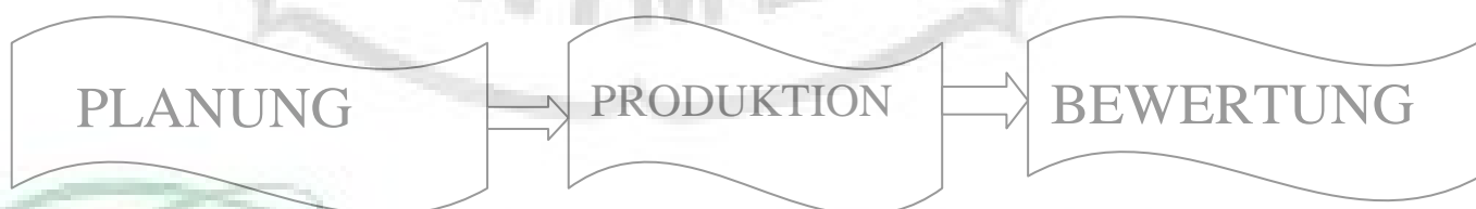
Bild 1. Die Schritte der Forschung und Entwicklung von Richey Und Klein.

Die dritte Phase ist die Evaluation. In dieser Phase wird das Produkt geprüft und bewertet. Das Ziel ist es herauszufinden, ob die Qualität des Produkt gut ist oder noch eine Verbesserung nötig ist.