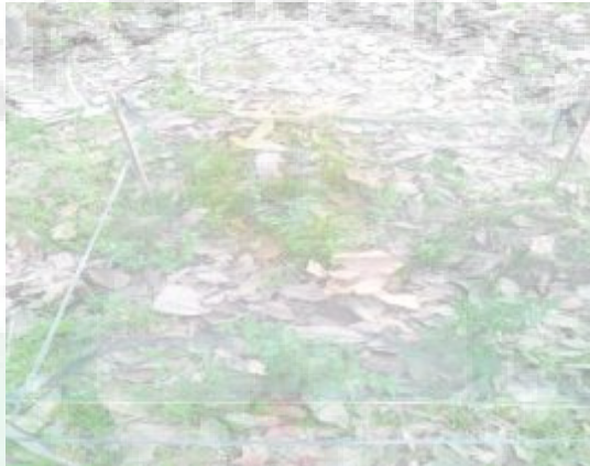
Gambar 3.7. Perangkap daun 1 X 1 (m)

Selanjutnya pembuatan perangkap daun sebanyak 25 perangkap di dalam 5 stasiun untuk memperoleh helaian daun yang akan diidentifikasi dalam perhitungan: