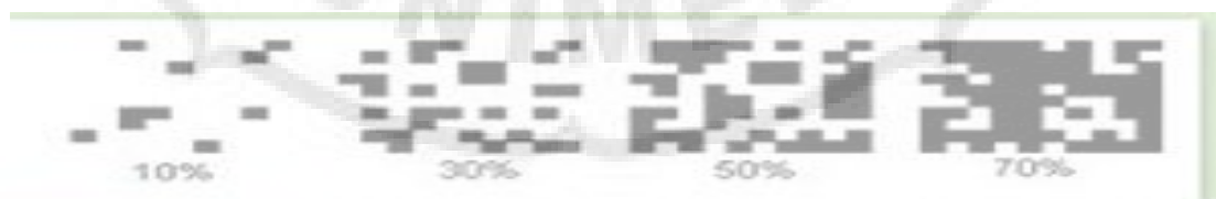
Gambar 3.6. Kerapatan tajuk (Sheriff, 1992).

Ilustrasi persentasi kerapatan tajuk pepohonan dilihat dari atas :