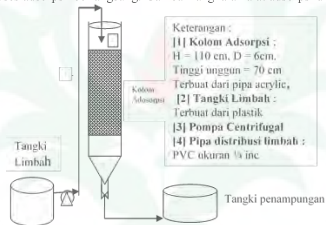
Gambar 1. Rangkaian Unit Adsorpsi

Pada tangki limbah proses adsorpsi dimasukkan limbah cair kelapa sawit sebanyak 10 liter. Kolom adsorpsi diisi dengan bentonit dengan ketinggian unggun 30 cm. Limbah dimasukkan melalui bagian atas kolom dengan menggunakan pompa dengan laju alir (1 L/mnt). Perubahan TOC diamati pada variasi waktu sirkulasi 15-180 menit selama proses adsorpsi berlangsung. Gambar rangkaian alat adsorpsi diperlihatkan Gambar 1.