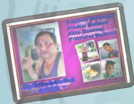
FAMILY FATHER & MOTHER I LOVE U