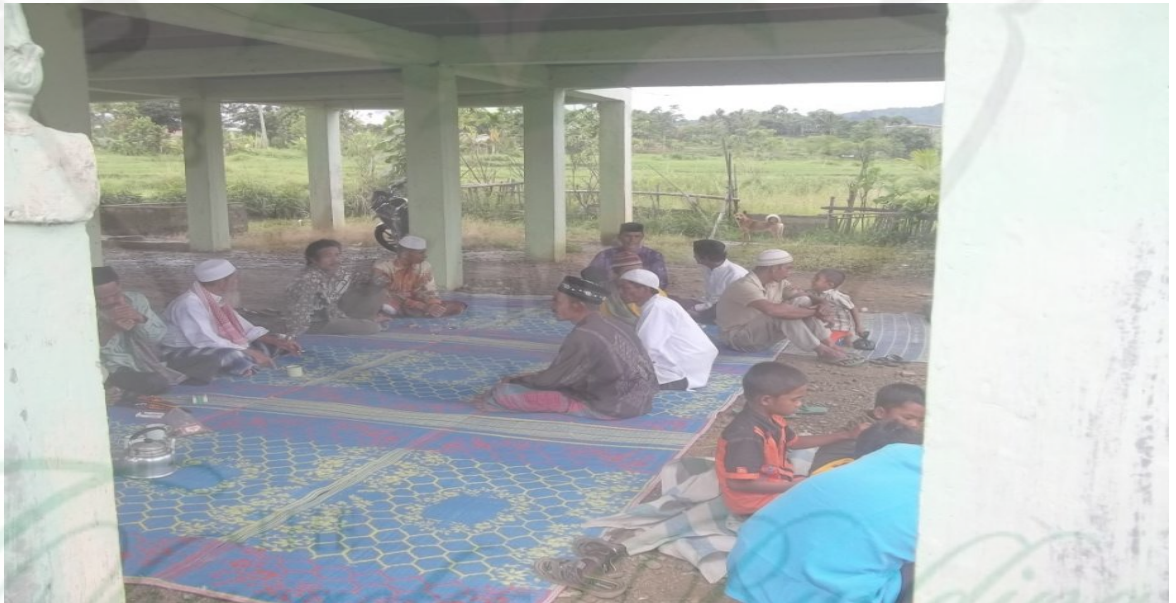
Gambar 6: Tampak adanya Interaksi Antara Masyarakat dengan Mantan anggota GAM yaitu pada acara Kurban Idul Fitri.