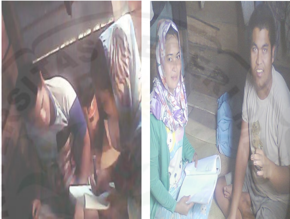
Gambar 5: Wawancara dengan Mantan anggota GAM.