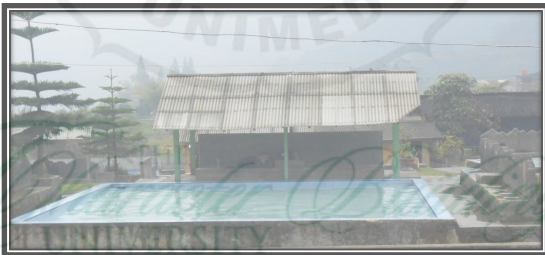
Gambar7. Kolam Pemandian Air Panas Lau Debuk-Debuk Di Desa Semangat Gunung Tahun 2013

Daya tarik utama kawasan Lau Debuk Debuk adalah kolam yang sekaligus tempat pemandian alam dengan sumber air panas yang mengandung belerang yang dipercaya dapat menyembuhkan berbagai jenis penyakit kulit, menghilangkan otot yang pegal, menurunkan kadar gula darah, melancarkan aliran darah, serta dapat juga dijadikan pengganti mandi sauna. Kolam air panas alam Lau Debuk-debuk memiliki luas 7 hektare. Dilengkapi arena parkir yang cukup memadai, shelter, dan kamar mandi. Dulu tempat tersebut hanya berupa aliran air alami saja, tetapi pihak swasta telah membuat kolam dari semen untuk membantu kenyamanan pengunjung. Sama halnya dengan fasilitas spa modern yang terdapat di banyak hotel berbintang, berendam di air dengan suhu 40° Celcius yang mengandung belerang sekitar 16 %, memang dianjurkan tidak boleh terlalu lama, cukup maksimal setengah jam saja. Namun itu sudah cukup menyegarkan tubuh kembali. Berikut ditampilkan pada Gambar 7 salah satu kolam pemandian air panas Lau Debuk-debuk di Desa Semangat Gunung.