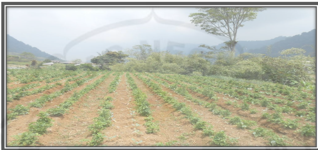
Gambar 5. Tanaman Pertanian Tumpang Sari di Desa Semangat Gunung Tahun 2014

Objek pariwisata kawasan Lau Debuk Debuk berada di kaki Gunung Sibayak yang membuat suasana menjadi sejuk yang juga dikelilingi dengan perbukitan. Disamping itu, objek pariwisata kawasan Lau Debuk Debuk juga memiliki pemandangan alam yang indah serta udara yang segar dan suasana nyaman.