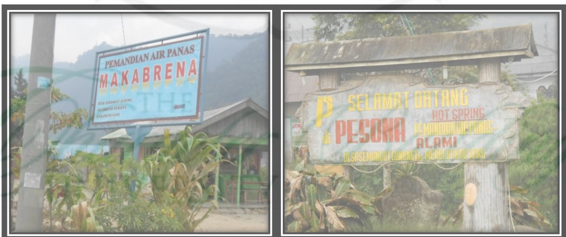
Gambar 6. Pemandian Air Panas Makbrena dan Pesona Alam di Desa Semangat Gunung Tahun 2013

Dari data tabel 8 menjelaskan bahwa luas areal pemandian terbesar dimiliki oleh Pemandian Alam Sibayak dan Rindu Alam yaitu sebesar 2 ha, sedangkan luas areal pemandian terkecil dimiliki oleh Pemandian Meliala yaitu 0,3 ha. Pemandian dengan jumlah kolam terbanyak dimiliki oleh Anugerah Sibayak yaitu sebanyak 12 kolam, sedangkan yang paling sedikit adalah Pemandian Makabrena, Purnama, dan Meliala yaitu masing-masing 4 kolam. Pemandian dengan jumlah kamar penginapan terbanyak dimiliki oleh pemandian Rindu Alam yaitu sebanyak 21 kamar, sedangkan pemandian Anugerah Sibayak, Makabrena, Meliala, Pariban, Pesona Alam, dan Taman Wisata Sibayak tidak memiliki jumlah kamar penginapan. Luas area parkir terbesar dimiliki oleh pemandian Alam Sibayak dan Rindu Alam yaitu 2700 m 2 sedangkan pemandian Meliala memiliki luas area parkir terkecil yaitu 150 m 2 . Jumlah kamar mandi terbanyak dimiliki oleh pemandian Rindu alam yaitu sebanyak 27 unit sedangkan pemandian Meliala memiliki 2 unit. Pondok istirahat yang terbanyak dimiliki oleh pemandian Alam Sibayak dan rindu alam yaitu sebanyak 15 unit, serta yang paling sedikit adalah pemandian Meliala sebanyak 2 unit. Berikut pada Gambar.6 foto pemandian air panas Makabrena dan Pesona Alam.