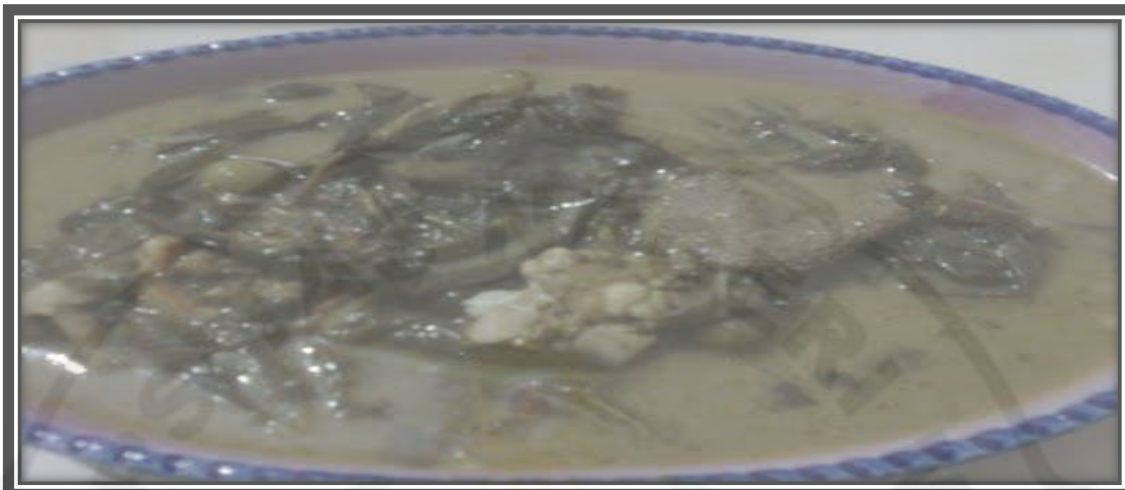
Gambar 10. Kuliner Terites di Desa Semangat Gunung Tahun 2014

Rumput yang digunakan belum jadi kotoran karena rumput ini diambil bukan dari usus besarnya atau bagian sistem pencernaan. Rumput ini masih segar karena ketika kerbau atau sapi memakan rumput maka rumput yang baru di mamah di mulut akan ditelan dan dimasukkan kedalam lambung penyimpanan (perut besar) dimana kemudian akan di mamah kembali baru rumput tersebut akan di masukan kebagian pencernaan.