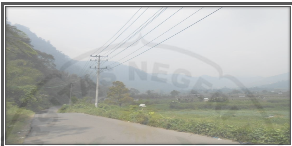
Gambar 12. Sarana Jalan Menuju Pemandian Air Panas Lau Debuk-Debuk Desa Semangat Gunung Tahun 2013