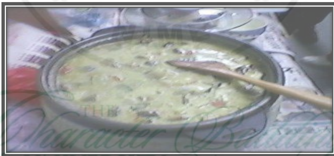
Gambar 9. Kuliner Cipera Di Desa Semangat Gunung Tahun 2014

Selain menyuguhkan pesona alam dan pemandian air panas yang sangat menakjubkan, desa Semangat Gunung juga menawarkan wisata kuliner khas diantaranya cipera, tasak telur, teritis. Cipera merupakan masakan khas Karo yang terbuat dari potongan ayam kampung termasuk leher, sayap, kaki, hati, ampela dan dimasak dengan tepung jagung sampai empuk dan berkuah kental. Tepung jagungnya harus dari bulir tua jagung, agar menghasilkan kuah yang kental. Bulir jagungnya disangrai terlebih dulu, kemudian ditumbuk menjadi tepung. Tepung jagung inilah yang sebenarnya disebut cipera. Kuah kental ini bercitarasa pedas karena memakai cabe rawit, dan sedikit asam karena memakai asam tikala (dari buah honje/kecombrang). Berikut pada Gambar 9 ditampilkan foto kuliner Cipera.