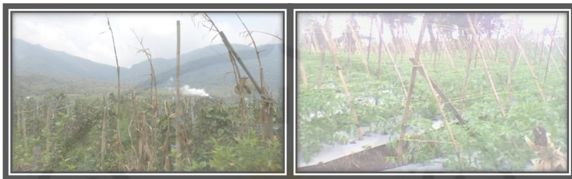
Gambar 4. Tanaman Buncis dan Tomat di Desa Semangat Gunung Tahun 2014

Tanaman buncis merupakan salah satu tanaman polong-polongan atau biji-bijian yang dapat dimakan. Tanaman ini banyak ditanam oleh penduduk Desa Semangat Gunung sebagai tanaman pertanian, karena dianggap memiliki harga jual yang cukup tinggi dibanding dengan harga sayuran yang lain. Tanaman lainnya selain buncis, yang menjadi salah satu tanaman pertanian yang dibudidayakan oleh penduduk Desa Semangat Gunung adalah tanaman tomat. Tanaman ini juga banyak di budidayakan pada daerah-daerah yang memiliki suhu udara yang tinggi. Tanaman ini juga merupakan salah satu tanaan sayuran yang sangat diperlukan sehingga selalu dibutuhkan pasar.