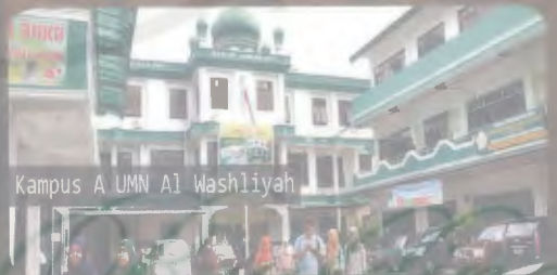
Kampus A UMN Al Washliyah

UNIVERSITAS MUSLIM NUSANTARA AL WASHLIYAH (UMN) MEDAN, SUMATERA UTARA, INDONESIA