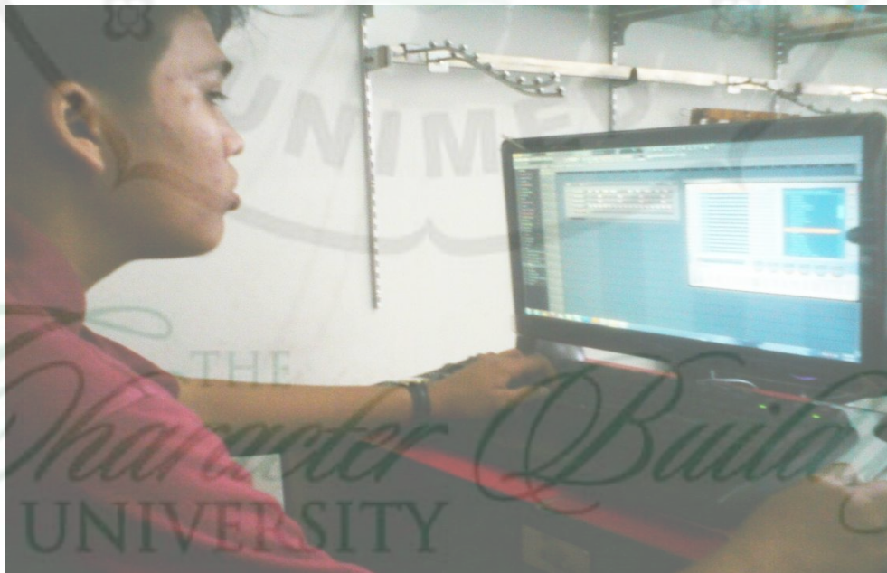
Gambar 2. Proses pembuatan musik hip–hop di Studio AQ Flow Medan