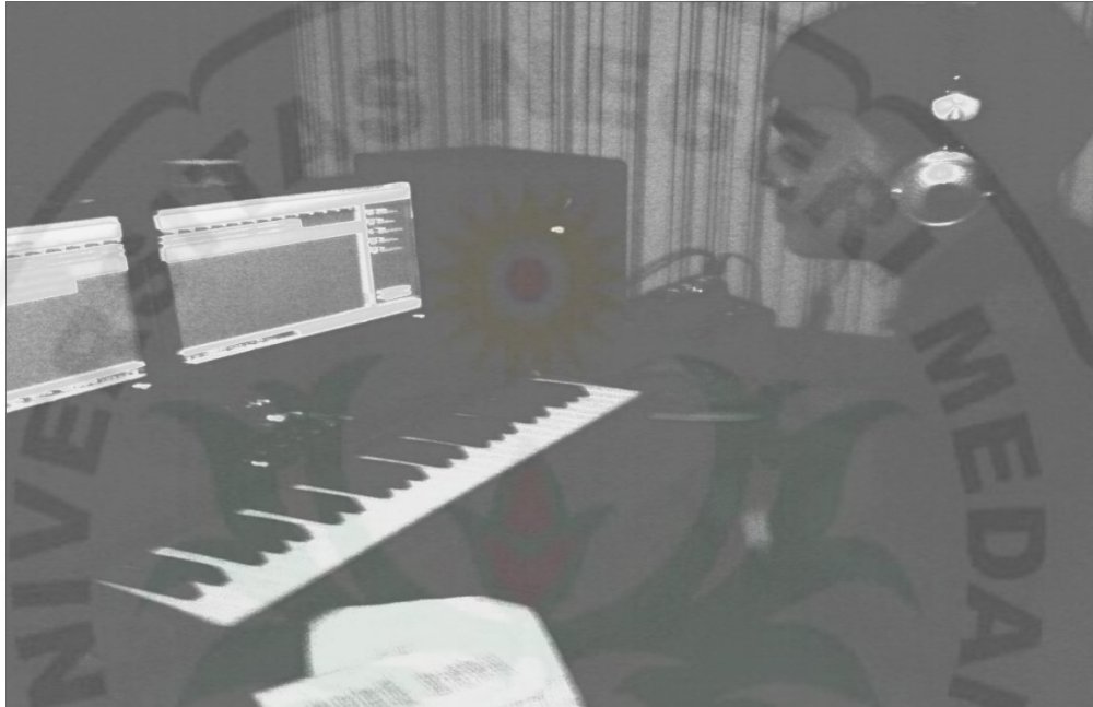
Gambar 1. Proses pembuatan musik hip – hop di Studio AQ Flow Medan