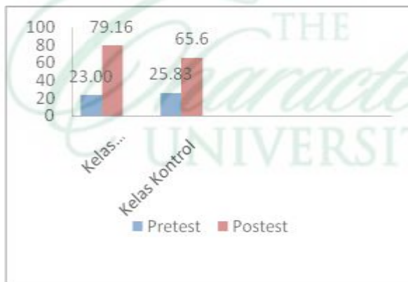
Gambar 1. Grafik Pres-Test Dan Post-Test Kelas Eksprimen Dan Kontrol

Berdasarkan tabel diatas maka dapat digambarkan perbedaan hasil perolehan rata-rata nilai pre-test dan post-test kelas eksperimen dan kontrol melalui diagram pada di bawah ini.