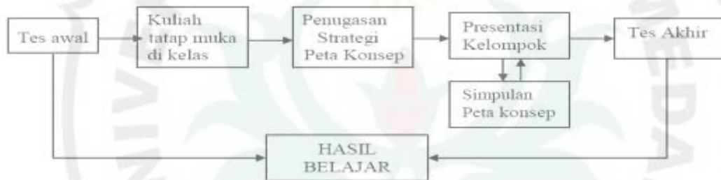
Gambar 3. Disain pembelajaran dengan strategi peta konsep

Setelah beberapa satuan unit perkuliahan disajikan maka dilakukan tes formatif. Analisis capaian hasil belajar mahasiswa dijadikan sebagai masukan untuk perbaikan pada perkuliahan berikutnya. Pada pertemuan terakhir akan dilakukan tes final sekaligus mengetahui capaian hasil belajar mahasiswa yang dikembangkan dengan strategi peta konsep. Proses pembelajaran dengan model penerapan strategi peta konsep ini dinyatakan seperti gambar berikut.