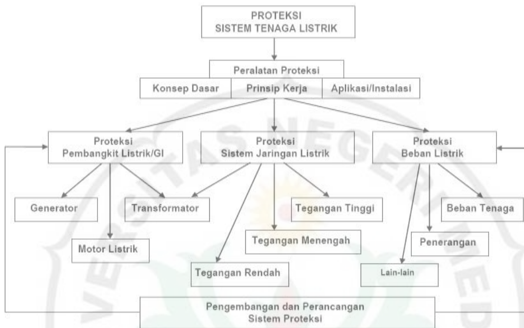
Gambar 1. Peta konsep proteksi sistem tenaga listrik