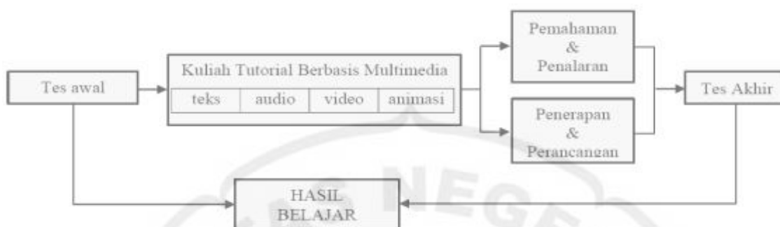
Gambar 3. Rancangan pembelajaran Berbasis Multimedia

Prosedur pembelajaran berbasis multimedia diawali dengan tes awal untuk mengetahui kemampuan sebelum mengikuti pembelajaran. Selanjutnya dilakukan orientasi pembelajaran beri pengarahannya tentang proses pembelajaran menggunakan multimedia yang akan dilaksanakan. Proses pembelajaran dalam model multimedia ini dilakukan dengan belajar tatap muka dan dilanjutkan dengan pembelajaran tutorial yang menggunakan multimedia instruksional bagi setiap individu menggunakan multimedia yang dikembangkan. Multimedia berisikan bahan ajar dalam bentuk teks, visual, auditori, video dan animasi dengan sasaran kemampuan pemahaman, penalaran, penerapan dan perancangan. Setelah selesai satu unit pembelajaran dilakukan tes akhir.