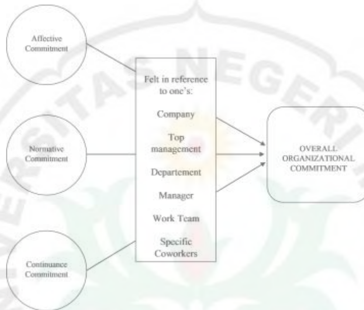
Gambar 1. Drivers of Overall Organizational