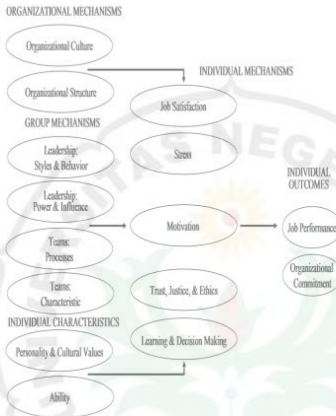
Gambar 2. Model Integrasi Perilaku Organisasi

Sumber: Jason A. Colquitt, Jeffery A. Lepine, dan Michael J. Wesson. 2009. Organizational Behaviour. Improving Performance and Commitment in the Workplace . New York : McGraw-Hill. p. 8