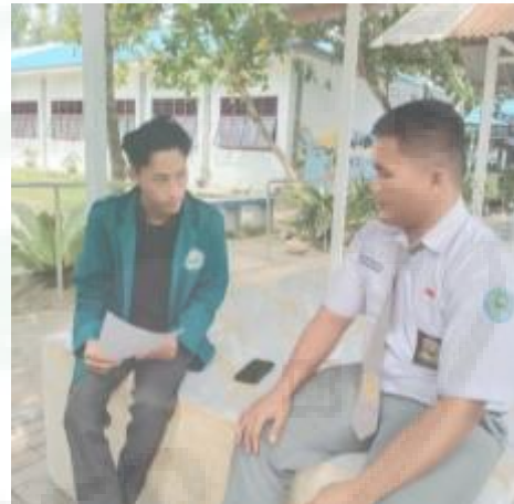
Wawancara dengan Siswa Tuna Netra Kelas 12 (I-16)