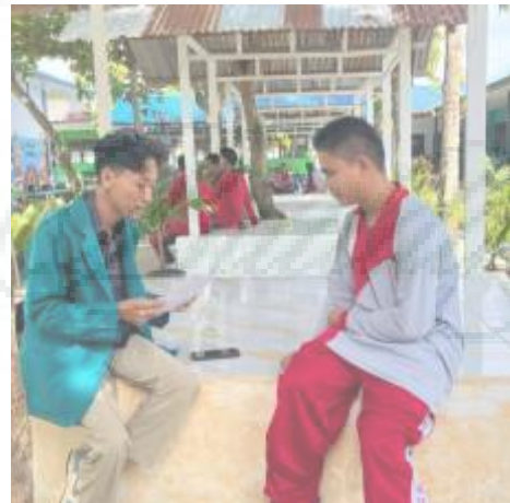
Wawancara dengan Siswa Tuna Netra Kelas 12 (I-12)