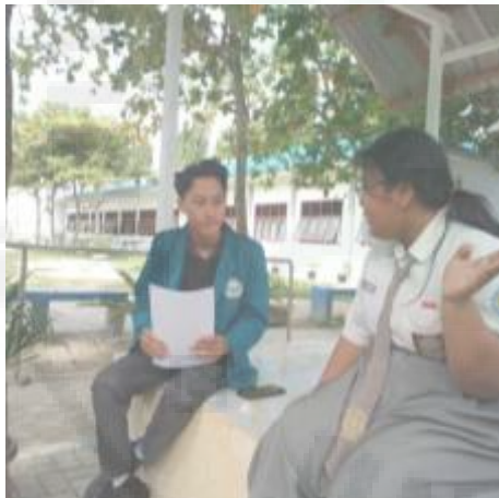
Wawancara dengan Siswa Reguler Kelas 12 (I-15)