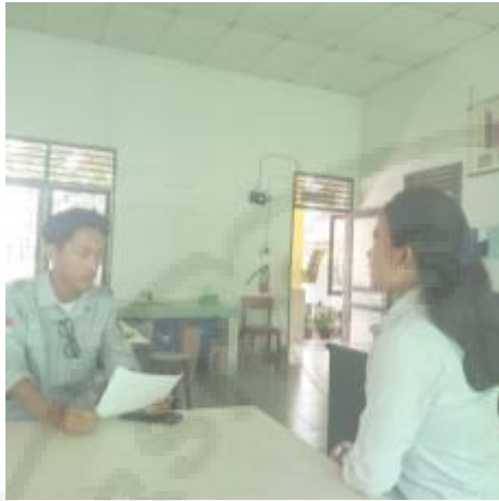
Wawancara dengan Wali Kelas (I-7)