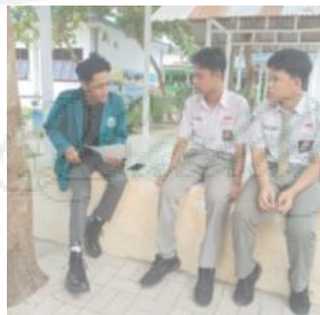
Wawancara dengan Siswa Reguler Kelas 12 (I-18, I-19)