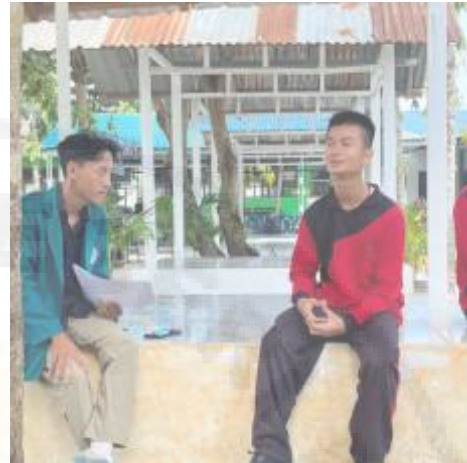
Wawancara dengan Siswa Tuna Netra Kelas 11(I-8)