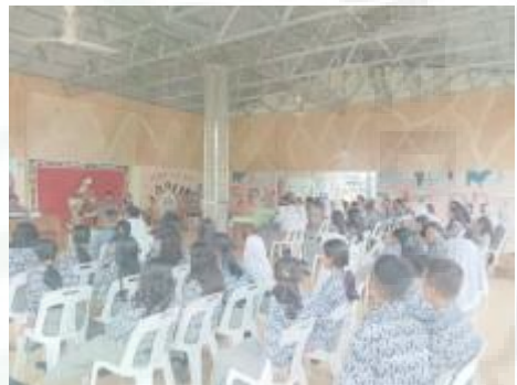
Acara siswa yang diselenggarakan osis