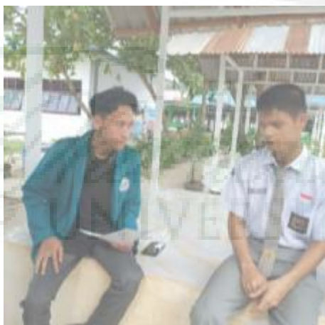
Wawancara dengan Siswa Tuna Netra Kelas 12 (I-17)