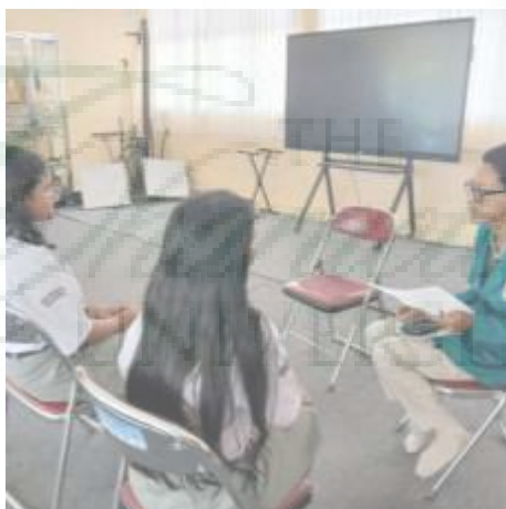
Wawancara dengan Siswa Reguler Kelas 11 (I-11)