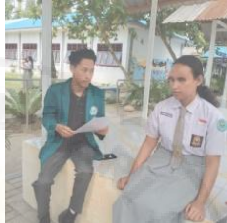
Wawancara dengan Siswa Tuna Netra Kelas 12 (I-14)