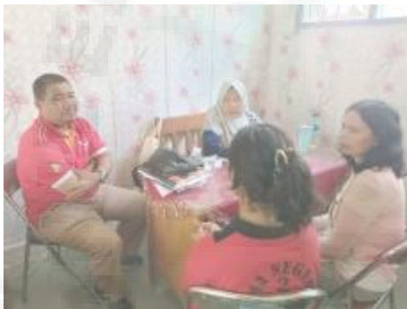
Kolaborasi dengan wali kelas, dan orang tua dalam mediasi masalah