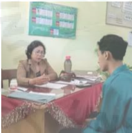
Wawancara dengan Guru BK (I-3)