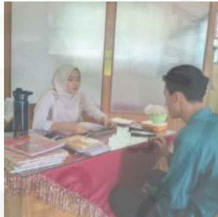
Wawancara dengan Guru BK (I-4)