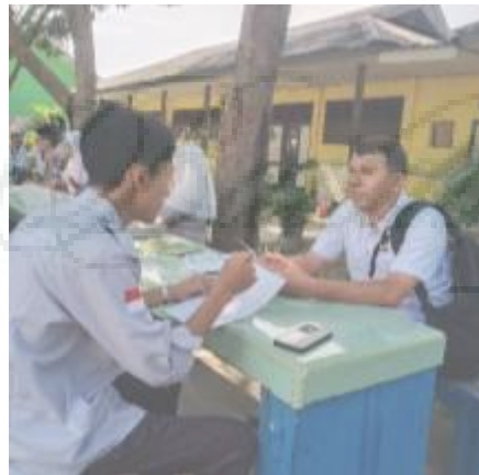
Wawancara dengan Wali Kelas (I-6)