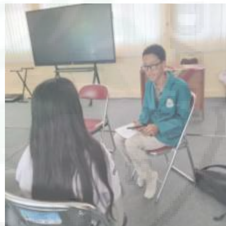
Wawancara dengan Siswa Tuna Netra Kelas 11 (I-10)