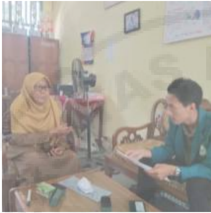
Wawancara dengan Guru BK (I-1)