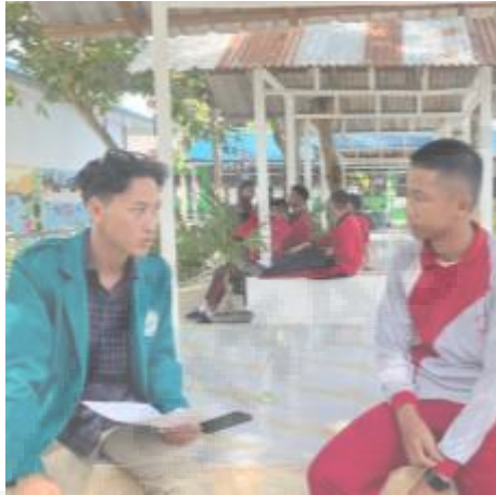
Wawancara dengan Siswa Reguler Kelas 12 (I-13)