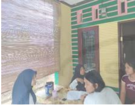
Guru BK melakukan Home Visit