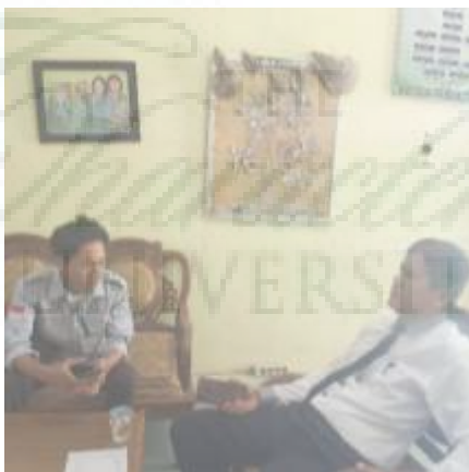
Wawancara dengan Wali Kelas (I-5)