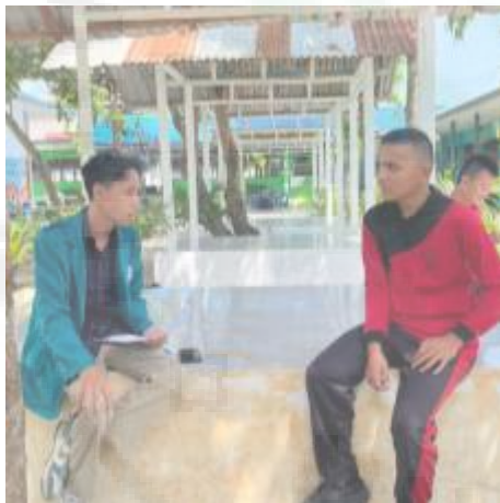
Wawancara dengan Siswa Reguler Kelas 11 (I-9)