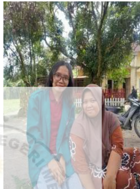
Wawancara dengan Ibu Awan