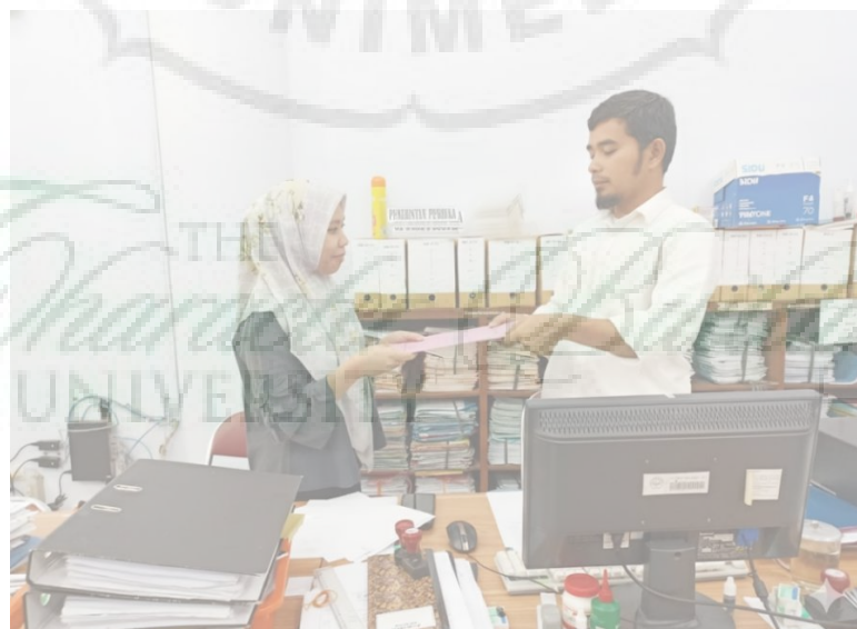
Gambar 8. Wawancara dengan Perwakilan Wakil Rektor III Bidang