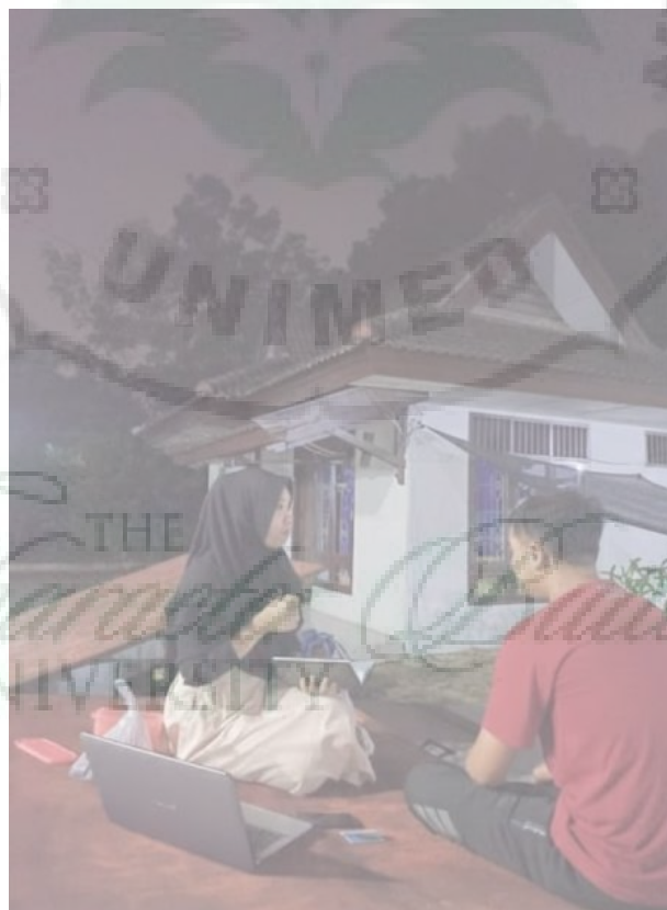
Gambar 4. Wawancara dengan Alumni Mahasiswa ADik dari daerah 3T