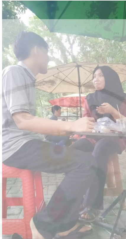
Gambar 5. Wawancara dengan Ketua Program Pertukaran Mahasiswa Merdeka