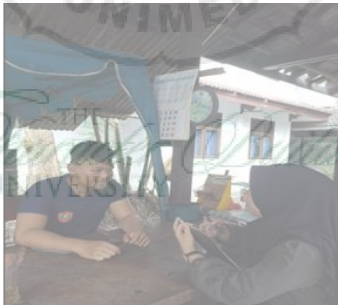
Gambar 6. Wawancara dengan Petugas Keamanan Asrama ADik UNIMED