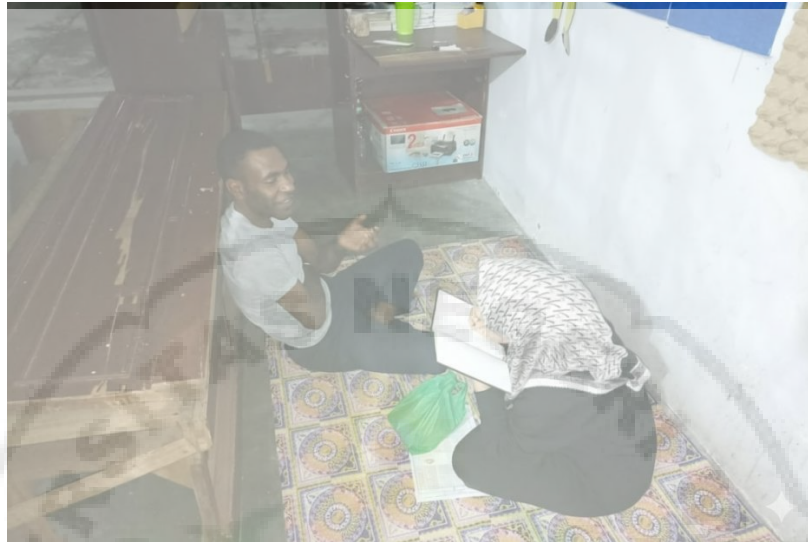
Gambar 3. Wawancara dengan Alumni Mahasiswa ADik asal Papua