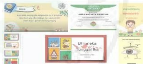
Gambar 3. Hasil Luaran yang dicapai PKM

Adapun luaran yang dicapai dari kegiatan ini meliputi berbagai media pembelajaran yang telah dihasilkan oleh para guru peserta pelatihan. Media pembelajaran tersebut mencerminkan desain dan kreativitas masing-masing peserta. Selain itu, peserta juga telah memperoleh kemampuan dalam membuat berbagai jenis materi lainnya, seperti sertifikat, flyer, spanduk, balihok, dan berbagai bentuk media grafis lainnya. Pencapaian ini menunjukkan efektivitas pelatihan dalam meningkatkan keterampilan peserta dalam memanfaatkan media berbasis Android untuk kebutuhan pendidikan dan komunikasi visual