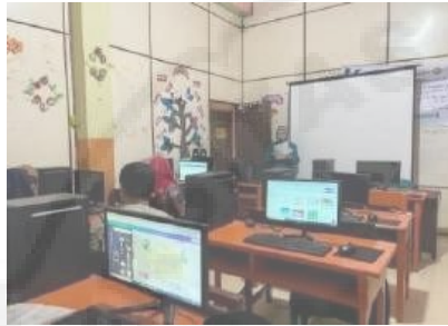
Gambar 2. Workshop PKM

Pada hari kedua dilanjutkan dengan kegiatan workshop dan coaching clinic penggunaan media pembelajaran berbasis android kepada guru-guru di yayasan Al-Hira Permata Nadirah dengan membuat bahan ajar dengan menggunakan media pembelajaran berbasis android dalam hal ini canva dan hasilnya akan didiskusikan pada hari selanjutnya.