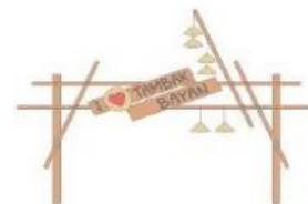
Gambar 3.5. Desain Gapura (Spot Foto)

Rangkaian kegiatan Pengembangan Desa Wisata Saentis Berbasis Sosial-Budaya Lokal Melalui Branding Image Wisata dapat dilihat pada gambar-gambar berikut: