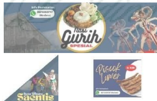
Gambar 3.2. Hasil Desain Komunikasi Visual