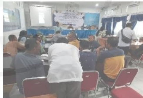
Gambar 3.1. Pelaksanaan Pelatihan

Desain komunikasi visual adalah ilmu yang mempelajari konsep komunikasi dan ungkapan daya kreatif, yang diaplikasikan dalam berbagai media komunikasi visual dengan mengolah elemen desain grafis terdiri dari gambar (ilustrasi), huruf, warna, komposisi dan layout. Semuanya itu dilakukan guna menyampaikan pesan secara visual, audio, dan audio visual kepada target sasaran yang dituju. Pada kegiatan Pengembangan Desa Wisata Saentis Berbasis Sosial-Budaya Lokal melalui Pengembangan Desain Komunikasi Visual, Manajemen Usaha dan Branding Image Wisata ini, pelatihan desain komunikasi menggunakan aplikasi canva. Canva adalah platform desain dan komunikasi visual online dengan misi memberdayakan semua orang di seluruh dunia agar dapat membuat desain apa pun dan mempublikasikannya di mana pun. Melalui canva pesan visual yang efektif secara informatif dan komunikatif yang dikemas sekreatif mungkin dapat dengan mudah tersampaikan dengan tepat sasaran. Adapun kegiatannya dapat dilihat dari kegiatan berikut ini :