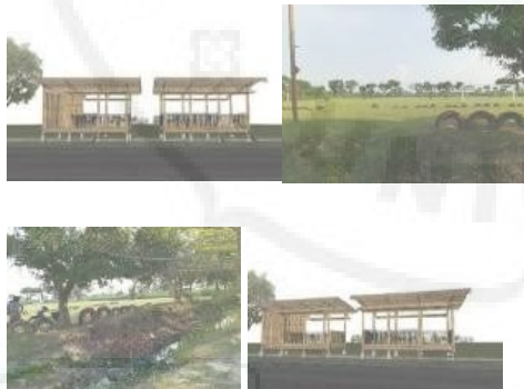
Gambar 3.4. Desain Cafe Bambu

Selain Desain Komunikasi Visual diatas, ada juga desain yang sangat istimewa yang diserahkan ke Desa Saentis dan apabila diaplikasikan sangat mendukung kegiatan Desa Saentis menjadi Desa wisata, desainnya berupa desain Cafe yang merupakan café yang sangat unik serta memanfaatkan kondisi atau kultur wilayah dari Desa Saentis tersebut, desain tersebut menggambarkan sendi-sendi kehidupan masyarakat desa saentis, kultur maupun budaya dari masyarakat sekitar, karna dapat dilihat dari struktur desainnya, desain cafe tersebut apabila diplikasikan menggunakan bahan baku yang ada disekitar desa, yakni berupa bamboo dan bahan lainya yang ada disekitar desa. Adapun desain Cafenya dapat kita lihat pada dokumentasi berikut ini: