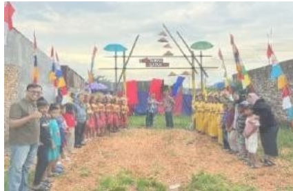
Gambar 3.6. Serah terima Spot Foto kepada Pendiri Rumah Kreatif

Dari Desain gapura (Spot Foto ) siatas direalisasikan dalam bentuk real di rumah kreatif, adapun bentuk real dari gapura (spot foto) adalah sebagai berikut: