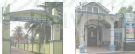
Gambar 1.1 Kantor Kepala Desa Saentis

Desa ini berjarak 10.4 km. dari Fakultas Bahasa dan Seni Unimed, mudah diakses karena jalan yang bagus dan juga tersedia transportasi umum. Desa ini terdiri dari 20 Dusun, yaitu Dusun I sampai Dusun XX. Lokasi utama tempat wisata berada di Dusun IV, dimana pekerjaan utama masyarakatnya adalah sebagai pedagang, petani dan peternak. Masyarakat yang berprofesi sebagai pedagang memproduksi dan menjual produknya untuk orientasi kebutuhan pendatang, yaitu wisatawan yang berkunjung ke Desa Saentis. Secara umum produk yang dihasilkan oleh masyarakat setempat dapat dikelompokkan pada produk makanan, kerajinan, dan Seni.