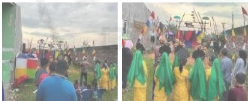
Gambar 3.7. Penampilan dari Anak Rumah Kreatif Tambak Bayan

Setelah serah terima spot foto dengan pendiri rumah kreatif, spot foto tersebut dimanfaatkan anak-anak penghuni rumah kreatif tambak bayan untuk melakukan penampilan tari, anak-anak rumah kreatif sangat senang dan antusias dengan adanya spot foto yang diberikan oleh Tim Pengabdian Unimed. adapun dapat kita lihat seperti gambar berikut ini: