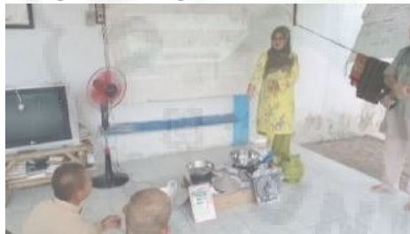
Gambar 1. Pengenalan Program

Pada tanggal 24 Mei 2024, sebuah langkah penting diambil oleh tim dosen Universitas Negeri Medan (Unimed) dalam upaya mereka untuk memberikan dampak positif pada komunitas lokal. Dalam sebuah acara yang penuh makna, tim dosen Unimed melaksanakan kegiatan sosialisasi pengenalan program serta memberikan serah terima peralatan masak kepada peserta panti rehabilitasi Bantara. Kegiatan ini bertujuan untuk memfasilitasi para peserta dalam mengembangkan usaha mereka, dengan harapan dapat mendorong mereka menuju kemandirian ekonomi.