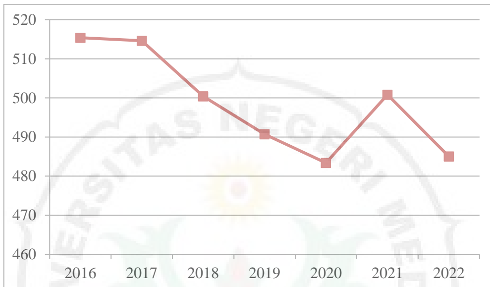
Grafik 1.1 Jumlah Penduduk Miskin (Ribuan Jiwa) Di Provinsi Riau