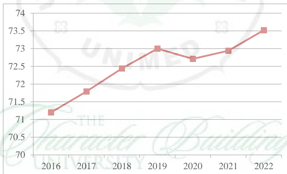
Grafik 1.4 Indeks Pembangunan Manusia (IPM) (%) Provinsi Riau