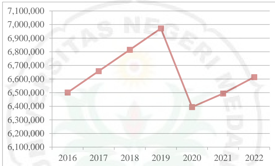
Grafik 1.3 Jumlah Penduduk (Juta Jiwa) Provinsi Riau