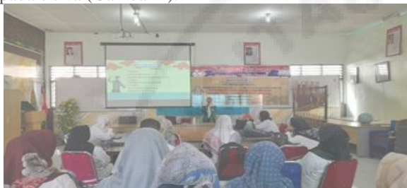
Gambar 2. Sosialisasi Program Kepada Guru Di SLBN Binjai.

Sosialisasi diberikan dengan melihat gambaran umum budaya masyarakat Kota Binjai, pengenalan program sendratasik katarsis budaya Melayu, dan penjelasan manfaat sendratasik katarsis bagi siswa disabilitas. Hasil yang didapat dari kegiatan sosialisasi, guru mendapatkan pemahaman betapa pentingnya pembelajaran praktik seni melalui sendratasik katarsis di SLB Negeri Binjai dalam meningkatkan kreatifitas dan kecerdasan kinestetis pada siswa (Gambar 2).