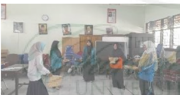
Gambar 3. Pelatihan Sendratasik Katarsis Budaya Melayu.

Berdasarkan hasil monitoring yang telah dilaksanakan oleh tim diperoleh bahwa guru dapat menerapkan pelatihan sendratasik katarsis budaya melayu kepada siswa berkebutuhan khusus autisme, downsyndrome , tunarungu dan tunanetra. Keberhasilan kegiatan pelatihan dapat dilihat dari antusias para guru dan siswa saat dalam kegiatan belajar mengajar kesenian drama, tari, dan musik. Siswa disabilitas mampu menampilkan bakat yang telah diasah bersama guru kedalam bentuk pentas