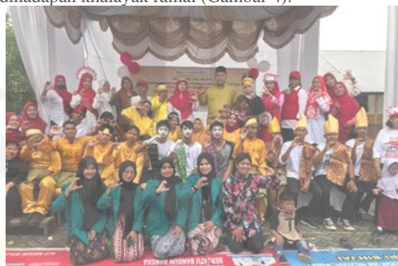
Gambar 4. Monitoring Dan Evaluasi Penerapan Program Sendratasik Katarsis Budaya Melayu.

pertunjukan drama musikal dengan percaya diri dihadapan khalayak ramai (Gambar 4).