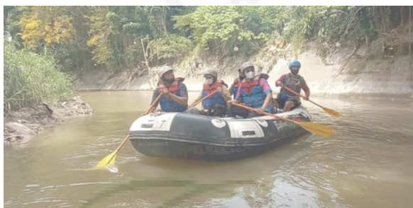
Gambar 1. Kegiatan Observasi Susur Sungai Babura

Kampung Sejahtera yang dulunya dikenal dengan Kampung Kubur terletak di pinggir Sungai Babura, Kecamatan Medan Babura, Kota Medan, Sumatera Utara. Sungai Babura merupakan salah satu sungai yang memiliki potensi besar untuk dikembangkan sebagai objek wisata alam.