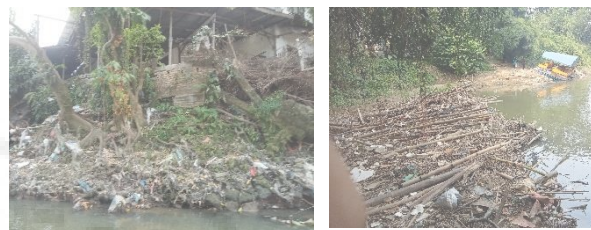
Gambar 6. Potret Sampah Di Bantaran Sungai Babura

e. Pemberdayaan Masyarakat: partisipasi masyarakat sekitar sungai dalam menjaga Daerah Aliran Sungai sangat diperlukan untuk menurunkan angka pencemaran lingkungan, namun partisipasi masyarakat masih rendah dalam menjaga kebersihan aliran sungai, disebabkan kebiasaan yang menganggap membuang sampah ke sungai lebih praktis dan mudah. Hal tersebut berkaitan dengan perilaku yang sudah terbiasa dilakukan oleh masyarakat yang tinggal di sekitar Gambar 6. Potret Sampah Di Bantaran Sungai Babura sungai (Firmansyah, 2015). untuk mewujudkan pembangunan berkelanjutan, pengelolaan lingkungan perlu melibatkan masyarakat. Perkembangan lingkungan global juga merupakan faktor yang selalu perlu dicermati. UU Nomor 32 Tahun 2009 yang mendasari pelaksanaan Perlindungan dan Pengelolaan Lingkungan Hidup menegaskan bahwa masyarakat perlu dilibatkan sebesar-besarnya dalam pengelolaan lingkungan hidup (Marlina, 2012). Melalui partisipasi aktif dalam program ini, masyarakat lokal merasa lebih terlibat dalam upaya pelestarian lingkungan mereka dan memiliki peran penting dalam perbaikan kondisi Sungai Babura.