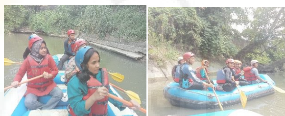
Gambar 3. Kegiatan Observasi Sungai Babura

Berdasarkan hasil wawancara dengan salah satu anggota komunitas, dan hasil observasi sungai babura, perencanaan Kawasan wisata susur sungai Babura ini sudah direncanakan juga oleh pemerintah Kota Medan, Wali Kota Medan, Bobby Nasution berencana akan menjadikan sungai di Kota Medan sebagai kawasan heritage. Sebab, Kota Medan terbentuk dari pertemuan dua sungai, di antaranya Sungai Babura dan Sungai Deli.