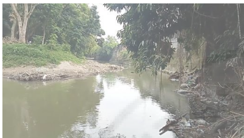
Gambar 5. Kondisi Aliran Sungai Babura

untuk merumuskan solusi terhadap masalah lingkungan di sekitar Sungai Babura.