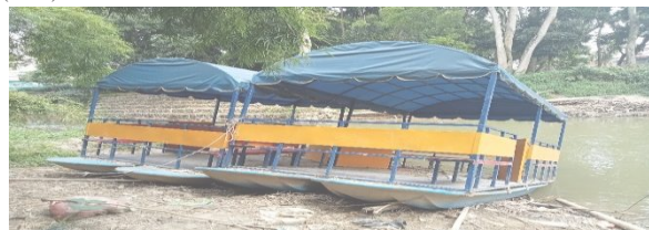
Gambar 4. Bantuan CSR Yang Terbengkalai

Komunitas yang mendukung kawasan wisata ini cukup banyak, untuk diketahui dalam kegiatan susur sungai itu P3KS berkolaborasi dengan berbagai komunitas, mulai dari Explorer Sumatera, Vertical Rescue Indonesia (VRI) dan Pewartar Foto Indonesia (PFI) Medan.