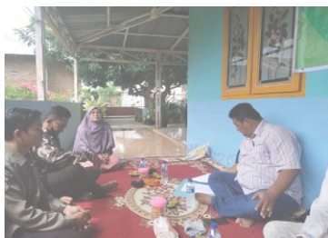
Gambar 2. Pembukaan oleh Ketua Tim PKM.