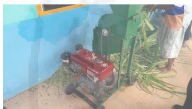
Gambar 7. Rumput Hasil Cacahan Mesin.