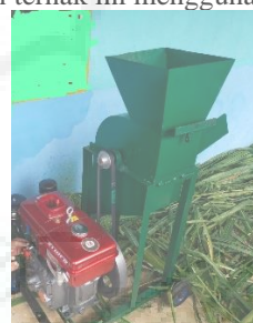
Gambar 5. Mesin Pencacah Pakan Ternak.

Adapun bagian-bagian mesin pencacah pakan ternak adalah sebagai berikut: Rangka mesin berguna untuk memperkokoh struktur mesin. Tabung pencacah berfungsi sebagai tempat pencacahan dan sebagai dudukan pisau diam. Di dalam tabung terdapat pisau yang berfungsi untuk mencacah bahan baku. Corong pemasukan untuk memudahkan memasukkan bahan baku yang akan dicacah. Wadah pengeluaran ntuk mempermudah penampung hasil cacahan. Penggerak mesin berupa diesel maupun motor listrik. Biasanya disesuaikan dengan kebutuhan pengguna. Dalam hal ini mesin pencacah pakan ternak ini menggunakan diesel.