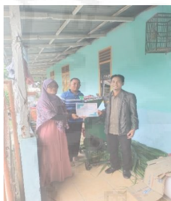
Gambar 9. Penyerahan Sertifikat Kepada Narasumber.

Kegiatan ini disambut positif oleh para peserta yang berterima kasih kepada dosen-dosen Unimed yang telah memfasilitasi terselenggaranya kegiatan pelatihan ini sehingga memberikan ilmu terkait pemanfaatan dan perawatan mesin pencacah pakan ternak. Mereka berharap ilmu yang telah diperoleh dapat digunakan untuk menambah pemasukan demi kemajuan masyarakat Desa Sidodadi.