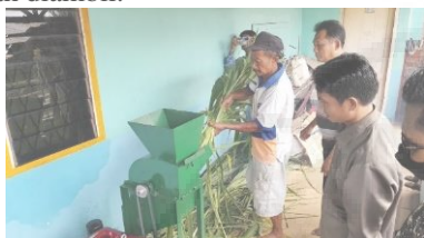
Gambar 6. Peserta Berlatih Menggunakan Mesin Pencacah Pakan Ternak.