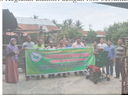
Gambar 10. Foto Bersama Tim PKM dan Peserta Setelah Selesai Pelatihan.

Kegiatan selesai pada pukul 16.00 Wib. Ketua tim PKM mengucapkan terimakasih kepada peserta pelatihan yang telah berkenan hadir dan mengikuti kegiatan pelatihan sampai selesai. Kegiatan diakhiri dengan foto bersama.