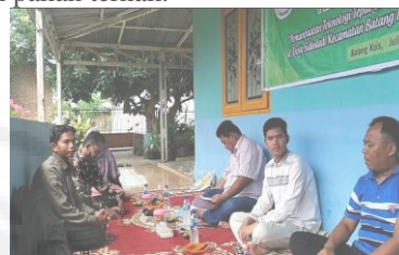
Gambar 4. Penyampaian Materi Oleh Narasumber.

Dalam kesempatan ini narasumber juga menjelaskan bagian-bagian mesin serta cara pengoperasian mesin pencacah pakan ternak.