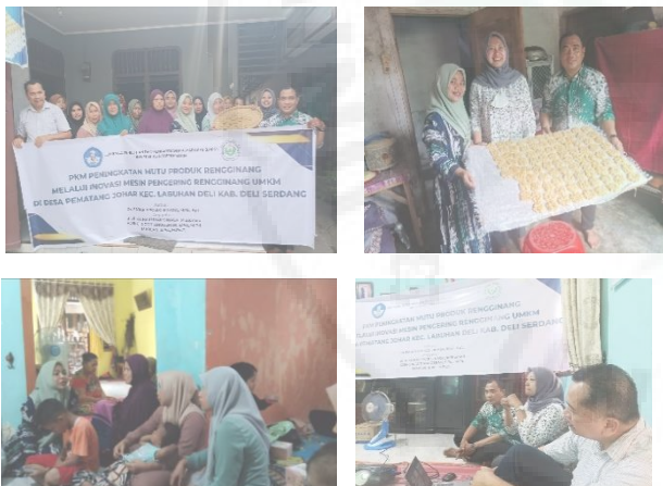
Gambar 4. Dokumentasi Saat Pelaksanaan Di Mitra

berkualitas . Dalam hal ini mitra menyiapkan tempat dan sangat antusias aktif dalam mendukung penuh kegiatan ini . kegiatan ini menunjukkan bahwa kegiatan pengabdian kepada masyarakat selalu dinantikan dan selalu menghasilkan kegiatan positif yang bisa terus dikembangkan sehingga menghasilkan nilai ekonomi yang semakin baik dengan pasar yang menjanjikan. Hasil salah satu inovasi kegiatan ini pengetahuan melatih dari Kesehatan ,manajemen pengelolaan dan penggunaan mesin penering rengginag dimana dengan adanya mesin ini sangat membantu pada proses peneringan yang biasanya memakan waktu sampai 2 atau 5 hari sekarang hanya butuh lebih kurang 2 jam/ hari, untuk produksi sekali produksi bsamapi 3 kg bahkan seminggu samapi 10 kg kalua seminggu 6 hari bahkan sampai 18kg dan kalua perbulan bahkan lebih tinggi berdasarkan permintaan pasar pada sat hari besar ,dengan kegiatan ini diharapkan agar dapat meningkatkan ekonomi atau produktivitas kelompok Masyarakat atau mitra.