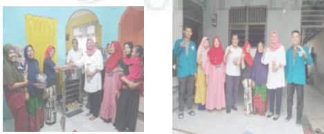
Gambar. 5 Penyerahan Mesin Penering Rengginag.

Tahap berikutnya dalam Pembuatan rengginang ini adalah penggunaan mesin penering rengginang dan memformulasikan untuk menciptakan varians rengginang , rasa , sehat dan berkualitas. Berikut ini penyerahan mesin penering rengginang kepada Mitra yang setuju oleh pendamping dari LPPM Unimed