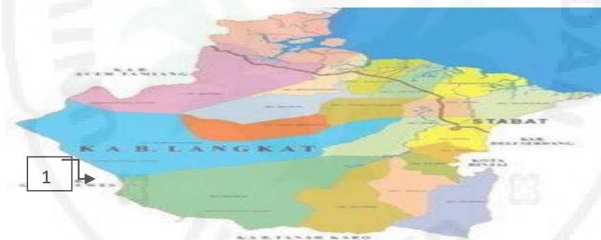
Image 1.1 La carte de Langkat

Dans l'apprentissage du Français du tourisme, le média d'apprentissage du Français du tourisme basés sur la culture locale de Sumatera du Nord sont encore peu nombreux. Par conséquent, il est nécessaire de développer de média d'apprentissage du Français du tourisme basés sur la culture locale de Sumatera du Nord qui se présente sous la forme de média vidéo intéressants et intéressants. Cela aidera grandement les étudiants qui étudient le cours du Français du Tourisme.