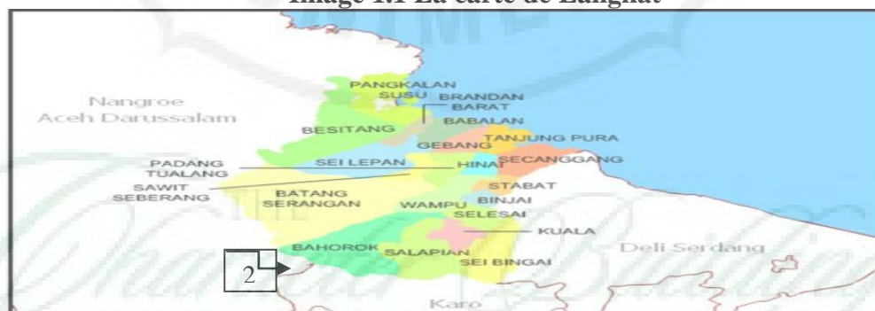
Image 1.2 La carte á Bahorok

De Langkat est l'une des régences de la province de Sumatera du Nord. La capitale actuelle de la régence de Langkat est Stabat. La distance moyenne de Medan City est d'environ 45 km au nord-ouest. La superficie de la régence de Langkat est de 6 263 km 2 ou 626 329 Ha, composée de 23 sous-districts qui sont