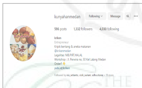
Gambar 2. Media Sosial KRIKEN

Permasalahan lainnya adalah masih kurang optimalnya penggunaan platform digital terutama media sosial Instagram dalam memasarkan produk.