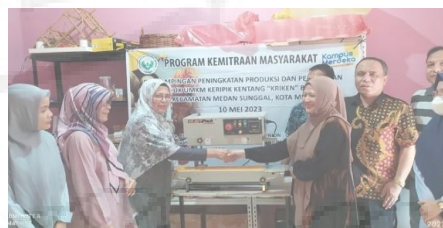
Gambar 3. Penyerahan Mesin Pengemasan

Dari uraian di atas hasil kegiatan program kemitraan masyarakat ini dapat dikelompokkan atas 2 bagian yakni pertama, tim PKM mengedukasi tim produksi dan resellers untuk meningkatkan wawasan dengan memberikan beberapa materi yang relevan dengan permasalahan yang dihadapi yakni: 1) materi tentang potensi dan kandungan gizi dalam kentang, 2) pentingnya menjaga mutu produksi dan menentukan segmen pasar dari produk kentang, 3) cara menaikkan jumlah pengikut atau follower , salah satunya adalah menggunakan Hashtag , terutama di media sosial Instagram, 4) membangun konten yang menarik dan salah satunya konten edukasi tentang manfaat dari kandungan kentang dan kedua, tim PKM menyerahkan 1 (satu) unit mesin continuous band sealer untuk pengemasan plastik dan 1 (satu) unit mesin induction sealer untuk pengemasan toples (Gambar 3), dan selanjutnya tim PKM memberikan pelatihan kepada tim operasional dalam penggunaan kedua mesin tersebut. Waktu yang diperlukan dalam mengemas produk jika menggunakan kedua mesin itu akan sangat jauh berkurang atau singkat dan kualitas pengemasan menjadi lebih baik. Akibatnya, jumlah produk yang dapat dikemas akan meingkat jauh perharinya dengan kualitas pengemasan yang lebih baik.