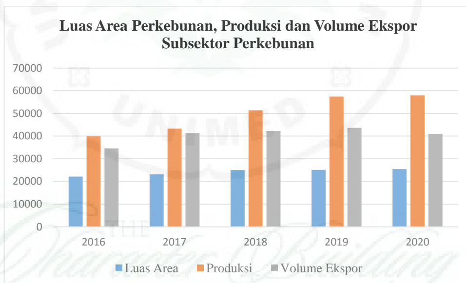
Gambar 1.1 Pertumbuhan Luas Area, Produksi dan Volume Ekspor Subsektor Perkebunan

Pertumbuhan Perusahaan subsektor perkebunan tampak dari pertumbuhan luas area perkebunan, jumlah produksi meningkat dan jumlah ekspor meningkat. Berikut grafik yang menunjukkan pertumbuhan subsektor perkebunan.