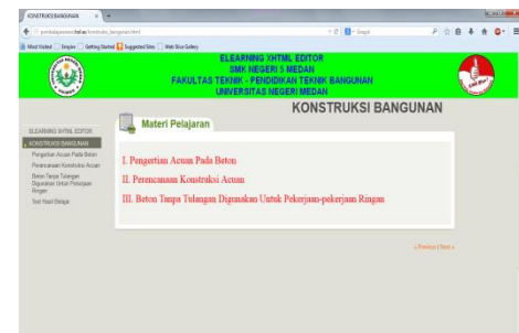
Gambar 2. Tampilan Fitur Materi Pelajaran

Pada tampilan awal ini, tersedia fitur-fitur pembelajaran yang terdiri atas fitur panduan, materi, latihan dan evaluasi pembelajaran. Fitur ini merupakan bagian dari rancangan pembelajaran ini