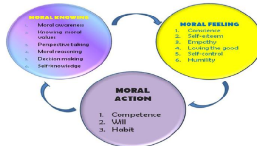
Gambar 2. Keterkaitan antara Moral Knowing , Moral Feeling dan Moral Action (JPNF, 2011)

Pendidikan karakter tidak hanya memperkuat akal, melainkan memelihara hati, sehingga bangsa ini memiliki pola pikir, pola sikap dan pola tindakan yang mulia atau luhur sesuai dengan nilai-nilai universal, karena karakter yang baik tidak terbentuk secara otomatis, melainkan bertahap, perlahan-lahan, melalui pembiasaan dan keteladanan. Dalam pendidikan karakter, tidak akan terlepas dari tiga hal yang oleh Thomas Lickona disebut sebagai moral knowing , moral feeling dan moral action . Keterkaitan di antara ketiga hal tersebut dapat dilihat pada Gambar 1 berikut ini.